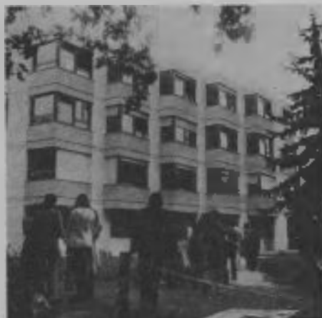
El nuevo edificio del internado de señoritas del Seminario Adventista de Francia, ubicado en Collonges sous Salève, en el suroeste de esa país, junto a la frontera suiza.

Entre varios nombres presentados para identificar el atractivo nuevo hogar de señoritas, se escogió el de La Clairière, debido a la gran luminosidad del edificio, que está ubicado entre los árboles, con una vista de Ginebra y su lago al frente, y el monte Salève en el fondo.—Eduardo E. White, corresponsal.