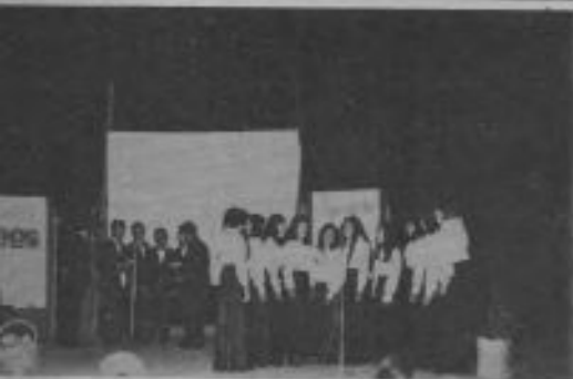
El grupo coral denominado "Los Amigos de Jesús" mientras actúa en la plaza de la ciudad argentina de San Juan, durante las actividades de la Semana del Optimismo.

director de la Escuela Radiopostal de la Unión Austral, se celebró en la Iglesia de Río Cuarto, Córdoba, la graduación de 62 alumnos de los cursos bíblicos. La mayoría de los que recibieron el certificado no eran adventistas, y muchos de ellos estaban haciendo planes para unirse a la iglesia. Los miembros están muy bien organizados como carteros misioneros y atienden personalmente a los interesados.