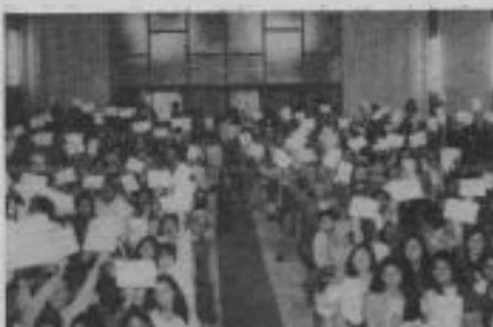
Algunas de las personas que fueron bautizadas como resultado de la campaña evangelizadora de Copiapó, llevan sus certificados de bautismo. Damos gracias a Dios por el buen éxito de esta obra.