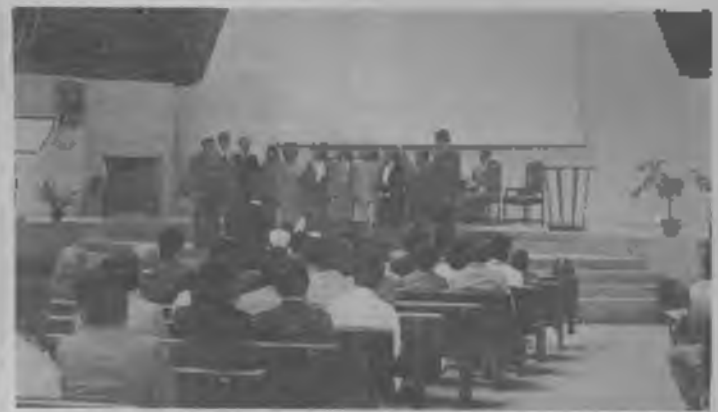
Instante en que un grupo de profesores entona un himno de alabanza durante un culto en el nuevo templo del CACH.