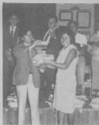
Una hermana del norte de Chile, en un curso de adiestramiento bajo recibe materiales para su trabajo.

• El Departamento de Ministerios de la Iglesia realizó tres cursos de adiestramiento, uno en cada asociación, en el que muchos hermanos recibieron la instrucción necesaria para