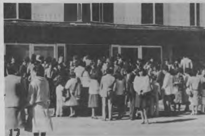
Un grupo de hermanas se saluda frente al nuevo templo del CACH al salir de una reunión de adoración.

En este año ya se han bautizado más de cuarenta almas en este distrito, con la ayuda de Dios y el trabajo sistemático de misioneros y hermanos laicos,