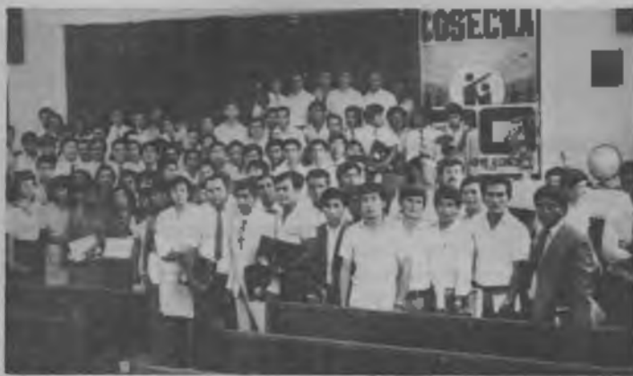
Este hermoso grupo de hermanos talcos recibió instrucción en el II Seminario de Evangelización Pública en Chiloayo, preparándose para predicar cincuenta noches seguidas.

Biblias, proyectoras y diapositivas; a fin de empezar unidos en la gran fecha esperada: sábado 22 de marzo de 1986.