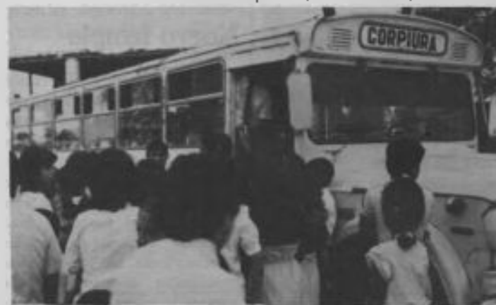
CORPIURA, un ente estatal, fabricó vehículos para trasladar a los candidatos y los hermanos hasta el lugar del bautismo en el río Piura.