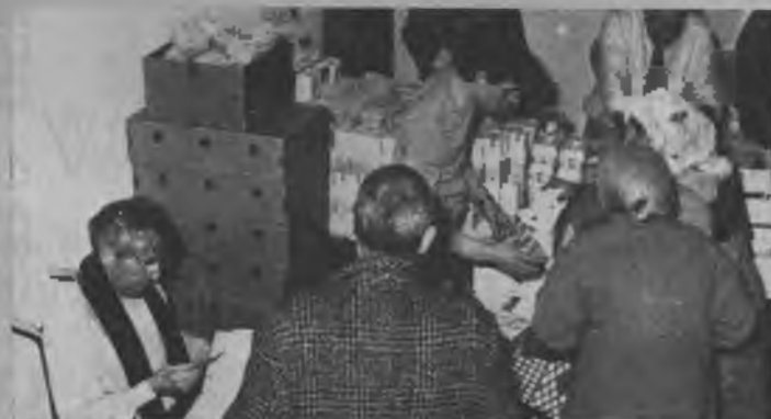
Los miembros de las iglesias de Séte y Montpellier, Francia, distribuyeron cerca de 43.000 comidas para 478 familias necesitadas a principios de este año. Las comidas fueron provistas por la Asociación de Restaurantes del Consorcio.

La escuela secundaria Sandia View, de Corrales, New Mexico, ha lanzado un programa de entrenamiento de jóvenes evangelizadores llamado TeeNacT, diseñado con el fin de preparar a