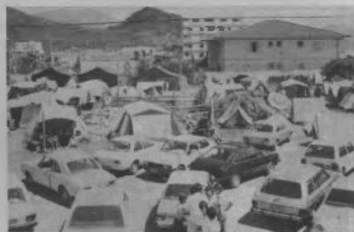
Cerca de trescientos jóvenes colmaron la capacidad de la sede de campamento JA de Santa Catarina, en Itapema.