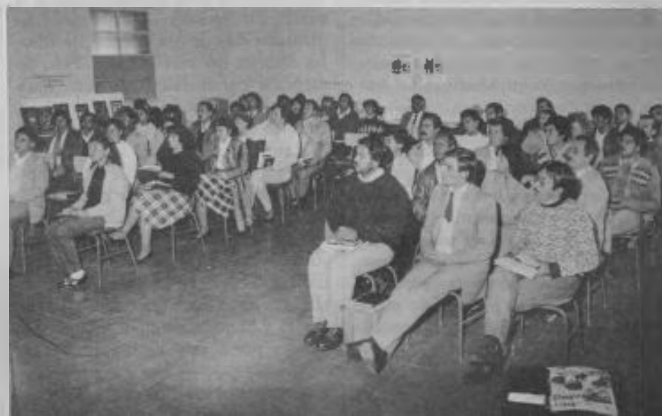
Estos 44 colportores firmaron la declaración que antecede. Desearios de experimentar la "Renovación" en Cristo.