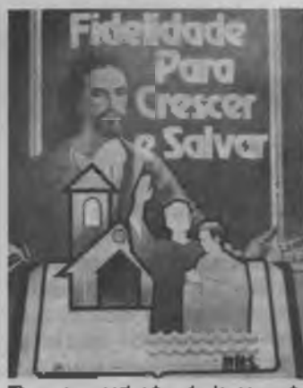
El poster motivador de la campaña "Fidelidad para crecer y salvar" de la Misión Mineira del Sur.