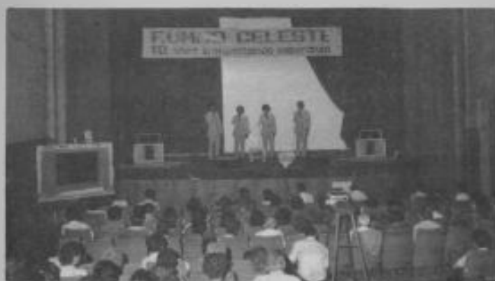
Al cumplir diez años, el cuarteto Rumbo Celeste ofrece un concierto en el Aula Magna de la Facultad de Odontología en Rosario.