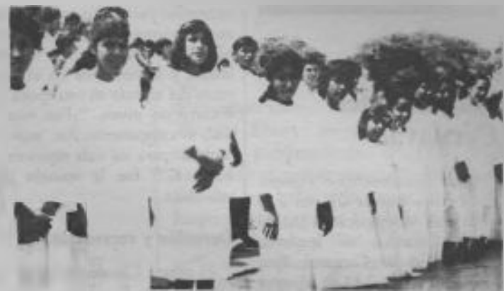
Parte de las 199 personas bautizadas como resultado de las conferencias dictadas en Piura.