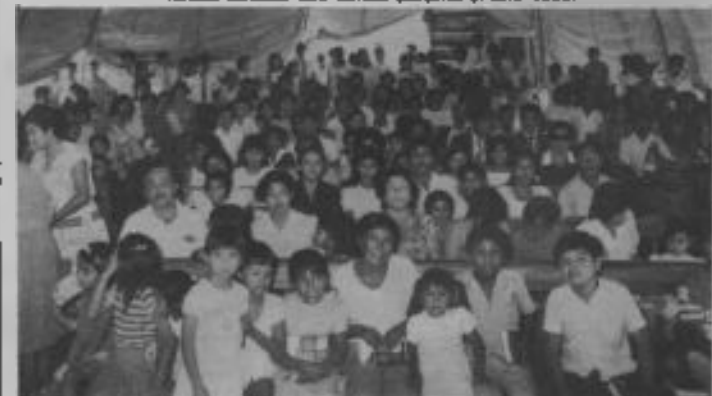
La carpa levantada en el distrito de Castilla, en Piura, se llena totalmente para la primera festividad sabbática durante las conferencias.