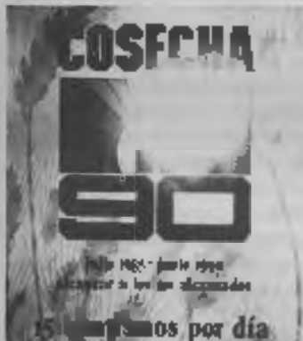
El poster preparado para estimular el programa Cosecha 90 en la Unión Chilena.

Bajo la dirección de Dios, la Unión Chilena está planificando estimular a los hermanos para que en Cosecha 90 logremos ganar 35 almas por día para el Señor. Como un elemento para recordarnos este objetivo, la