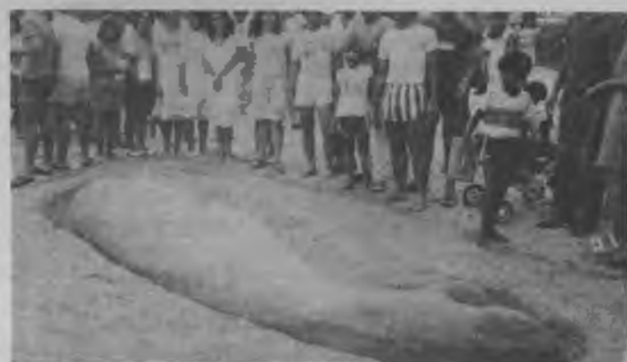
Una de las actividades que atrajo la atención de muchos jóvenes en el campamento fue el concurso de esculturas en la arena.

En su segundo trienio de actividades, la Misión Mineira del Sur, bajo el liderazgo del pastor Gerson Fragoso, el 15 de marzo lanzó una campaña de