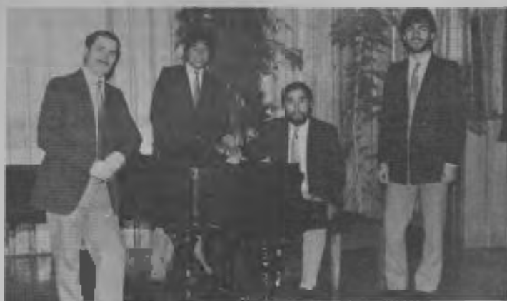
El cuarteto Invocación, de la Iglesia de Pioneros, Temuco, fue invitado a participar en Melbourne, Australia, de un ciclo de evangelización.

nuestras escuelas tienen, con los nuevos cursos del nivel parvulario y básico, más de 1.700 estudiantes.