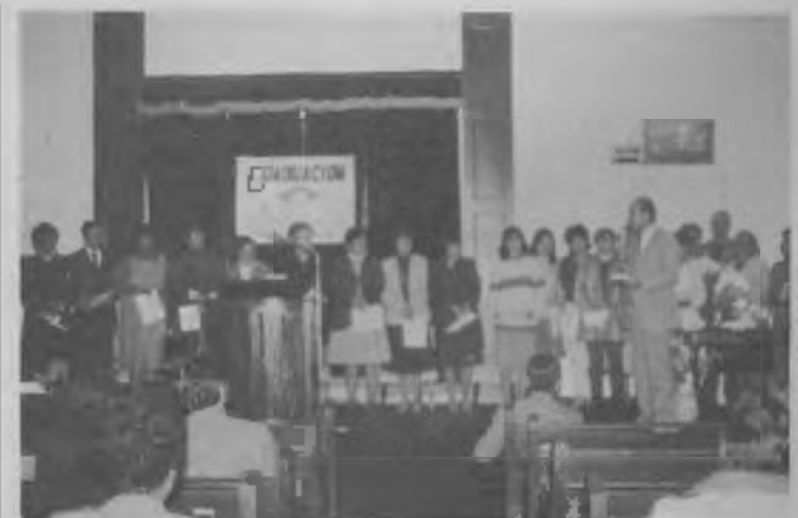
En la última graduación de la mini-filial de la Escuela Radiopostal de la Iglesia de Porvenir se entregaron 63 diplomas.