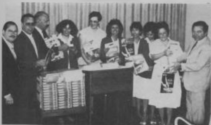
Administradores y secretarías de la Unión Chilena reciben los libros y revistas que se comprometieron a adquirir y distribuir en 1986 como parte de su aporte al plan Cosecha 90.

• Aprovechando el interés despertado por el cometa Halley, a fines del año pasado y comienzos de este, La Voz de la Esperanza imprimió y difundió una radiguña alusiva, y al mismo tiempo impulsó la formación de mini-filiales en todos