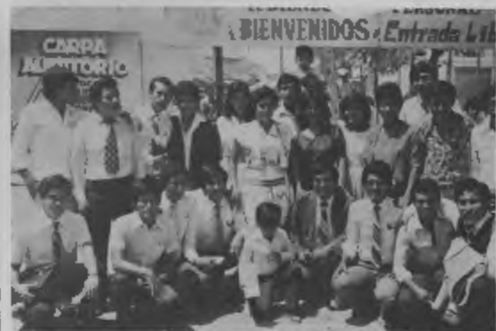
Un entusiasta núcleo de jóvenes concentró sus esfuerzos en la evangelización en el distrito de Piura.

La Universidad Nacional de Piura y la Corporación Departamental de Piura facilitaron