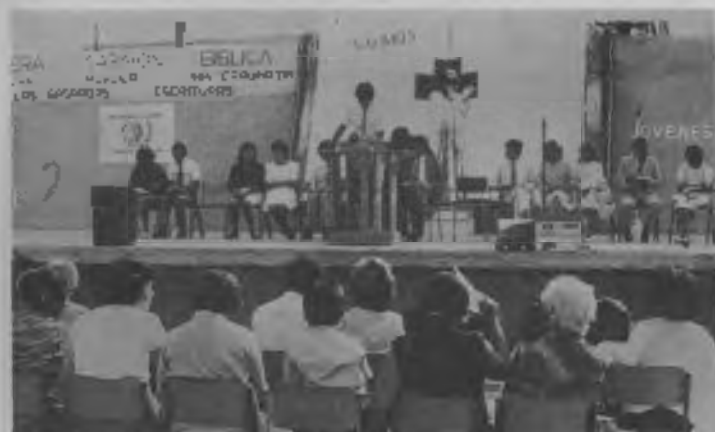
Uno de los jóvenes de Arica lee en el escenario levantado en el Parque Bofaz, la porción asignada en el transcurso de la Maratón Bíblica, en la que leyeron la Biblia completa en 54 horas y 27 minutos.

Las escuelas en la Misión del Norte contarán este año con quinientas Biblias nuevas y un abundante material para la evangelización. Actividades tales como clases bíblicas, además de las clases sistemáticas de religión, y semanas de énfasis espiritual, ayudarán para hacer del bautismo del 27 de septiembre un gran éxito en frutos para vida eterna. Este año,