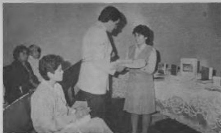
En el interior de la iglesia, los Jóvenes Adventistas de Tocopilla obsequian una Biblia al señor Alcalde de la ciudad.

Durante el acto, los jóvenes que acompañaron a quienes leían tuvieron la oportunidad de inscribir a más de quinientas personas en cursos bíblicos por correspondencia, y distribu-