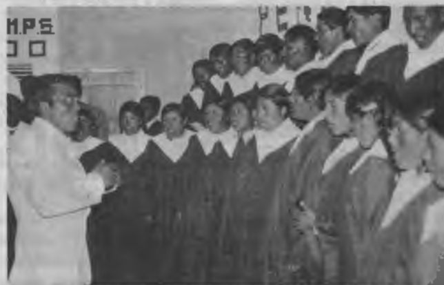
Los coros también acompañan el desafío de Cosecha 90 .