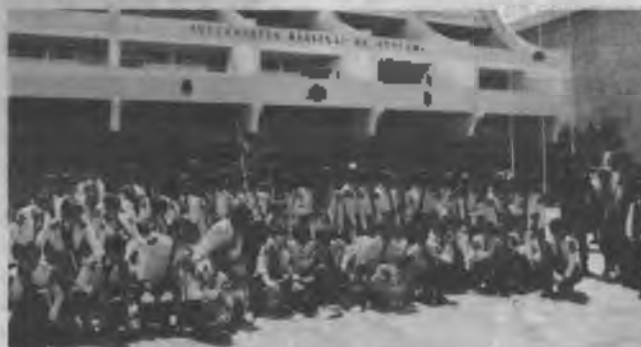
La banda instrumental del Colegio Adventista de Antofagasta toca ante el edificio de la Intendencia Regional de Atacama, en la ciudad de Copiapó. Fue en ocasión de su visita a ésta, y durante la cual acompañó a la escuela adventista local en su desfile anual.

El segundo viernes de noche se realizó una solemne cena del Señor y el sábado de tarde se entregaron los certificados a todos los participantes.— Reinaldo Gutiérrez C.