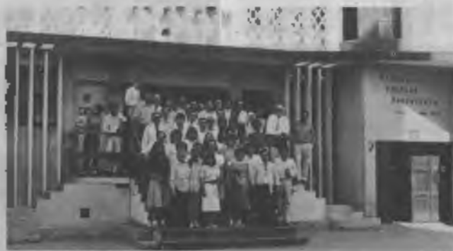
Asistentes al Primer seminario Maranata realizado en la Misión del Noroeste. El curso, organizado por el departamento de los Ministerios de la Iglesia de la misión, se desarrolló en el templo de la iglesia central de Tucumán.