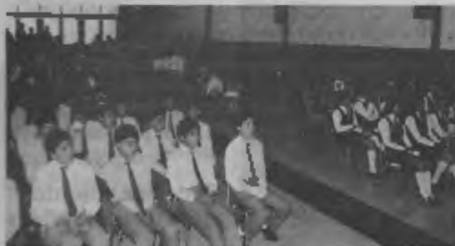
En primer plano, los alumnos de octavo año que egresaron a fines de 1988, en plena ceremonia de licenciatura.