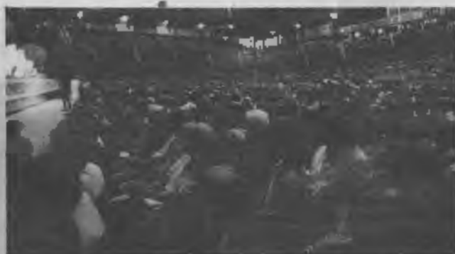
Una vista panorámica de las 15.000 personas que asistieron a los festejos de Una luz en el camino .

El Primer campamento JA de la Misión del Nordeste se realizó entre el 19 y el 26 de