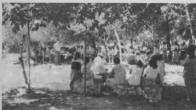
Capilla del bosque en el Primer campamento JA de la Misión del Noroeste. Se llevó a cabo en El Cadillal, Tucumán, un hermoso lugar para la meditación y el esparcimiento del espíritu.

En este año aniversario, y como producto del esfuerzo laico y del trabajo de nueve pastores del equipo evangelizador de la Asociación del Norte, se vio con alegría el bautismo de 326 personas. Fruto directo de las tres arrocarpas que actuaron durante tres meses, se bautizaron 222 almas. Y los hermanos de Posadas cumplieron con su misión evangelizadora aportando 104 bautizados, dos nuevos templos, la ampliación de un tercero y la