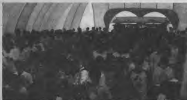
Parte de los 222 bautizados como fruto de la campaña realizada en Posadas.

La iglesia, que surgió en 1965 como fruto de una escuela misionera (con 400 alumnos en la actualidad), está empeñada en otro objetivo: comenzar en un futuro próximo la construcción de