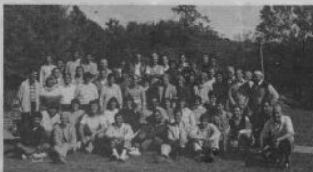
El grupo de 57 participantes del Primer seminario Maranata organizado por el departamento de los Ministerios de la Iglesia-Area AMES de la Asociación Central. Se realizó en Los Quebrachos, Córdoba.

Los 57 participantes vivieron una experiencia de intensa espiritualidad, en un clima cordido y fraterno, donde se intensificó la búsqueda en oración de la presen-