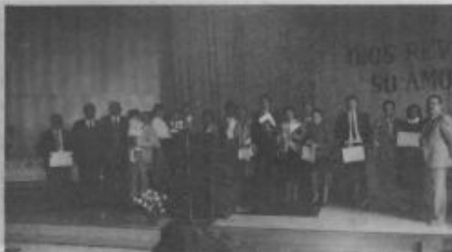
Hermanos que recibieron un certificado como reconocimiento por su eficaz labor misionera en la Iglesia de Copiapó.

Los diferentes clubes fueron clasificados en categorías de acuerdo con las pau-