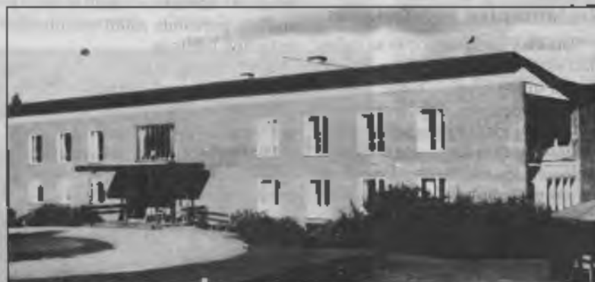
El Centro Adventista de Salud y Rehabilitación de Nyhyttan, cerca de Nora, Suecia.

Apenas terminó el primer curso, la prensa, la radio y la televisión nacional difundieron noticias acerca del programa de salud adventista. En las sesiones de apertura del