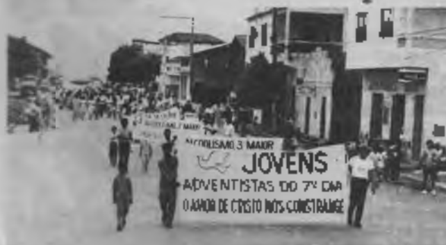
Los jóvenes adventistas predicaron de la temperancia en el centro de Nueva Venecia, Espiritu Santo.

Además de las actividades espirituales, los jóvenes participaron en diferentes juegos deportivos: vóleybol, carreras de 100, 400 y 800 metros, salto en alto, etc.