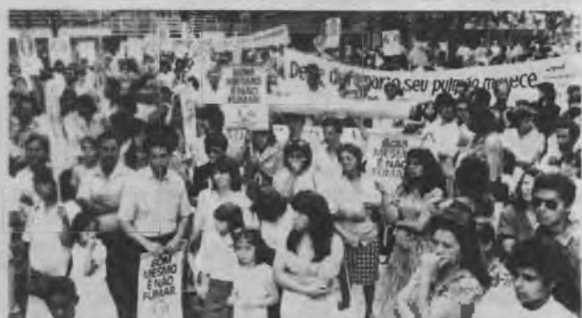
Una manifestación contra los perjuicios del tabaco en Londrina, Paraná.