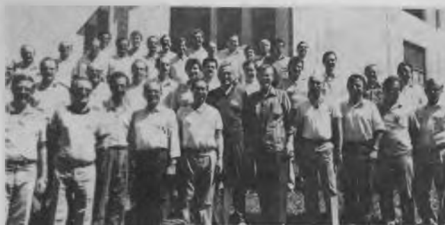
Los dirigentes de las instituciones adventistas se reunieron en Guarapani, Espiritu Santo, para seguir cursos de principios de administración.

El programa diario comenzaba con un tema devo-