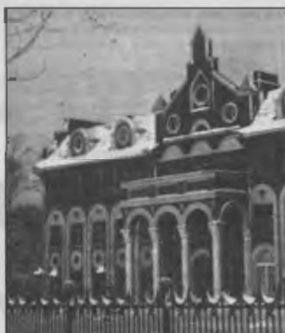
Fronte del edificio que sirve de sede y seminario para la Iglesia adventista en Rusia.