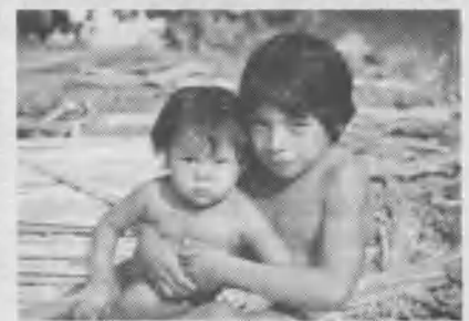
Niños de la villa de Jocifa.