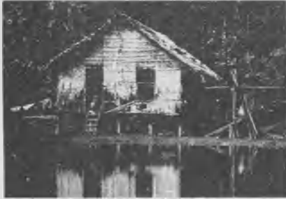
Viviendas típicas, construidas a orillas del río Amazonas, adaptadas a las crecientes de los ríos.

terio de Tulare, y luego en la reunión realizada en la iglesia adventista del mismo lugar, no pudimos menos que agradecer a Dios por el extraordinario espíritu que impulsó a estos siervos de Dios a entregar sus vidas en favor de la proclamación del evangelio en una región tan difícil.