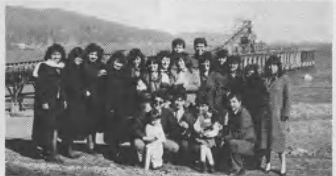
Profesores que participaron en el retiro espiritual del Colegio Adventista de Hualpencillo.