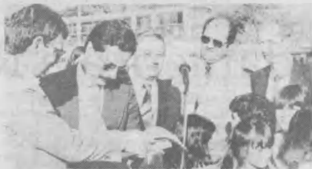
El intendente municipal oficializa la donación del terreno para la Escuela Adventista en Sorocaba, San Pablo.

La Casa Publicadora Brasileña (CASA), que actualmente imprime y encuader-