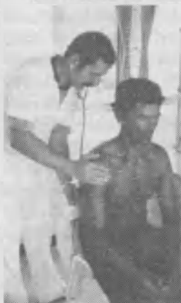
Los médicos examinan a los pacientes diariamente.

Al recordar la vida de este matrimonio, nos admiró que se lanzaron a lo desconocido con la certeza de que Cristo estaría con ellos. No conocían el continente al que se dirigían cuando abandonaron sus cómodos hogares de Nebraska, Estados Unidos, ni conocían el país donde vivirían durante prácticamente todo su ministerio. Menos aún conocían la dura vida del norte del Brasil. Sin embargo, no se detuvieron preguntando acerca de lo desconocido, sino que, habiéndose entregado a Cristo en una decisión de servicio total, avanzaron con la