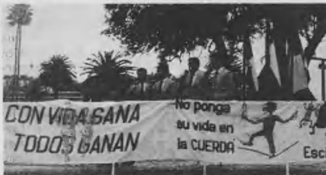
El cuarteto Decisión canta al finalizar la caminata que los jóvenes adventistas realizaron por el centro de Viña del Mar.

Como resultado de estos cursos y asambleas, cada minifilial está trabajando arduamente para alcanzar a los no alcanzados y atender a más de 3.800 alumnos. En los últimos 6 meses se llevaron a