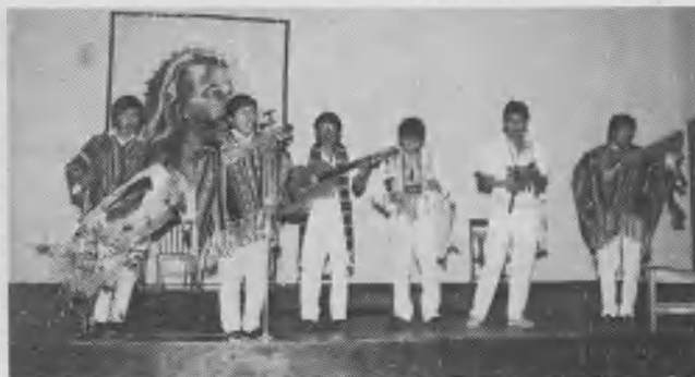
Integrantes del Conjunto Integración Ceabé, de Vinto, Cochabamba, Bolivia en una presentación cultural en el salón de actos del Ceabé, el 28 de julio de 1990, al dar un informe de su participación en el Congreso de Indianápolis.

Considerando que la Facultad de Teología posee características y régimen propios, según lo consagra el Estatuto de la UUI, y que su finalidad preponderante es la de formar a los futuros ministros de la Iglesia Adventista del Séptimo Día, fue: