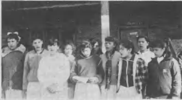
Coro de la Escuela Adventista de Puerto Iguazú en una presentación durante el acto del 11 de julio.

Del 25 al 27 de julio, organizado por la Cámara de Diputados de la Provincia de Tucumán, se realizó el I Congreso Interparlamentario sobre Drogadicción en el territorio de la Misión Adventista del Noroeste.