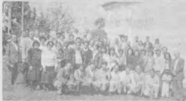
Del 20 al 25 de agosto ppdo. se llevó a cabo el II Concilio Pastoral de la Asociación Paulista Central. En la foto aparecen los pastores, con sus esposas, que participaron de un bendecido concilio. El encuentro sirvió para que los pastores confraternizaran, oraran al Señor por la presencia del Espíritu Santo, e intercambiaran reflexiones e ideas acerca de los planes misioneros de cada distrito.