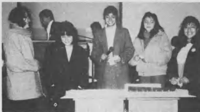
Grupo JA de la iglesia Cordillera que ganó el concurso sobre el Santuario.