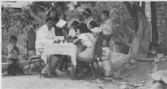
Una unidad del Club de Conquistadores en pleno estudio bíblico, en un hogar donde se abrieron las puertas y los corazones.

Gracias a Dios por haberlos cuidado y bendecido con 5 hijos, una hija adoptiva y 13 nietos. Anhelamos muchas y abundantes bendiciones en su vida personal, familiar y en su relación con la iglesia.— Misión del Oriente Boliviano.