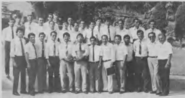
Pastores de la APC, participantes del Primer festival de siembra realizado en Lima, Perú, entre octubre y noviembre de 1990.

gratitud en el corazón de los hermanos de Puno A que comprobaron que el Espíritu Santo dinamiza con su poder a los hijos de Dios que están dispuestos a dar su tiempo, sus talentos y sus recursos para trabajar. La vida misionera engendra vida. Las iglesias grandes viven cuando engendran nuevas iglesias.