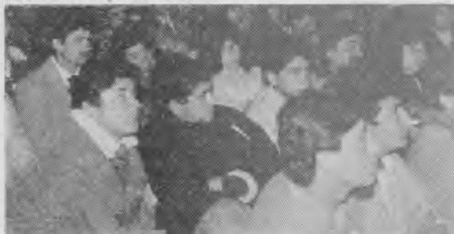
Parte de los asistentes al II Congreso de testificación.