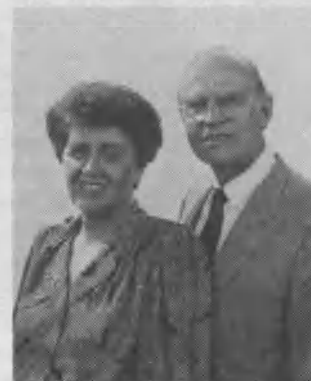
Los esposos Itin.

— ¿Puede decirnos algo acerca de su nueva responsabilidad en las Filipinas?