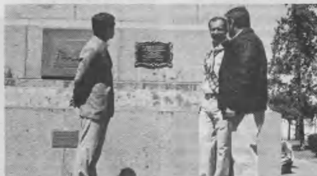
Un momento, luego del descubrimiento de la placa en homenaje al Libertador San Martín, en ocasión del Camporí de Conquistadores de la Misión del Sur.

Entre las actividades realizadas queremos mencionar las siguientes: 1) desfile de las delegaciones, partiendo desde la Casa de Gobierno y concluyendo en la Plaza San Martín, para descubrir una placa en homenaje al libertador. 2) Bautismo de 19 Conquistadores y consagración de todos a Jesús. Ese sábado se recibió la visita del vicegobernador de la provincia, Ing. Edén Caballero. 3) El domingo fue un día dedicado a la Feria de Conquistadores. Bajo el lema La naturaleza, nuestra amiga se presentó una demostración de habilidades de los perros de la Policía; exposición de manualidades y otros trabajos; concurso de marchas; demos-