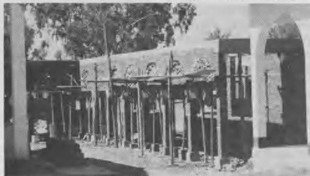
Estructura de la nueva biblioteca del Ceabé, al costado de las aulas y del salón de actos de la institución.

Así es como Chulla ya tiene su propio Club de conquistadores y sus integrantes realizan las mismas actividades que aprendieron de sus jóvenes instructores del Ceabé. Esta es la mejor cosecha que podíamos esperar. No sólo ver el bautismo de algunas personas que aceptaban el evangelio por la acción misionera de estos