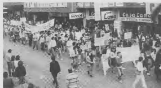
Marcha de temperancia en Chillán, como cierre del congreso JA de la ASCh.