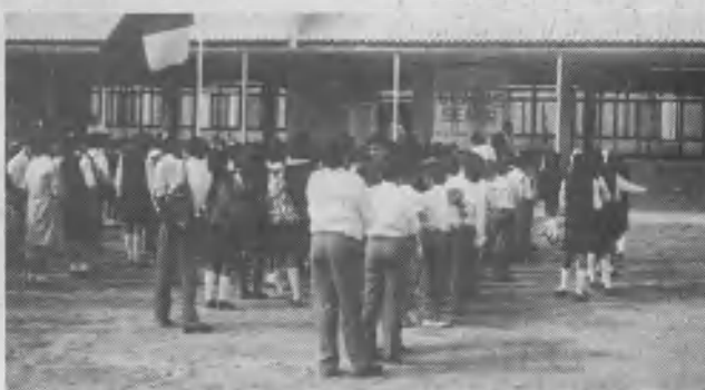
En la instantánea aparecen los alumnos frente a las nuevas instalaciones inauguradas al comienzo del año lectivo.

La feligresía y la organización, además de participar en el regocijo del Pr. Ponce, hará bien en apoyarlo con sus oraciones y estímulo que lo fortalecerán en el desempeño de las nuevas responsabilidades que el Señor le encomendó.