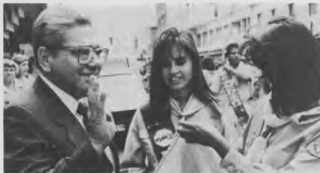
En la instantánea aparece el señor alcalde de la ciudad en el momento de recibir la pañoleta que lo distinguió como miembro honorario del club

También utilizamos este título para encabezar el editorial de nuestra edición de junio. Lo consideramos adecuado para informarles ahora que en el contexto de Misión global , la