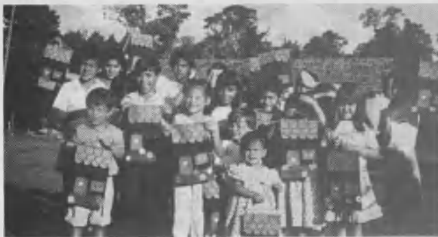
Los hijos de los colportores, que también participaron de la asamblea, muestran el bolso con forma de casa que recibieron para guardar sus folletos de escuela sabática.