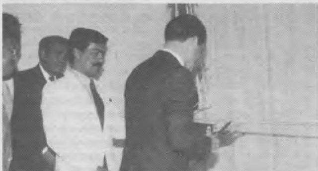
El superintendente de la refinera en el momento en que se apres- ta a cortar la cinta tricolor.

• El Día del conquistador tuvo amplia repercusión moti-