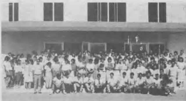
Grupo de profesores que participó en el seminario.