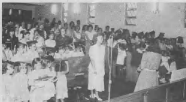
En la ceremonia de graduación, la iglesia casi se llenó con la presencia de los padres de los niños que se graduaron.

sábado, ACES, en sociedad con el SEHS, entregó los premios del "mes máximo". Fueron premiados 18 colportores; entre otros estímulos, los premios consistieron en un freezer , heladeras, ventiladores, cocinas, licuadoras y otros electrodomésticos.