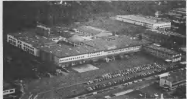
Vista panorámica de Granovita, la fábrica adventista de producción de alimentos ubicada en Alemania.

En respuesta al informe de la comisión, el Pr. Robert S. Fol-