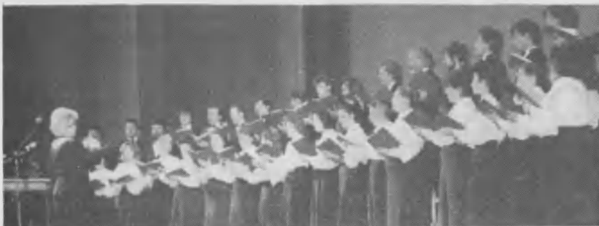
Un coro de cámara de músicos adventistas provenientes de toda la Unión Soviética, acompaña las presentaciones del Pr. Spangler.