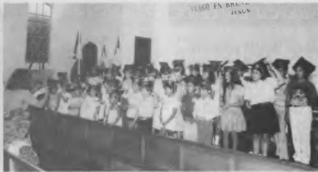
Momento cuando los graduados de la escuela cristiana de vacaciones cantan en la ceremonia realizada en la iglesia de Las Acacias.

sidente del Consejo General de Educación y Ministerio de Educación de la provincia de Santa Fe. También ejerció el Ministerio de Gobierno, Justicia y Culto e, interinamente, tuvo a su cargo el gobierno provincial.