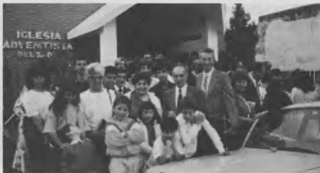
Los hermanos de Villa Nueva frente a su flamante templo.

Más adelante, el Senador agregó: "Es a todas luces plausible