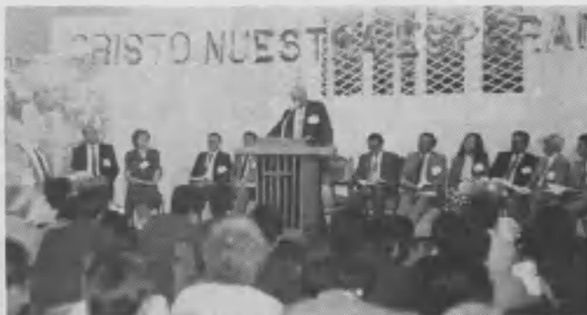
El presidente de la Unión, Pr. Eliel Almonte, exhortando a los delegados.

ta Adventista esperamos muy sinceramente que la “mayor participación de la mujer” proyectada en las megatendencias enunciadas, llegue a ser muy relevante a nivel del hogar, para que el “marcado renacimiento religioso” que se espera, sea la recompensa satisfactoria del ministerio de la maternidad cristiana que tiene tan poco reconocimiento social en nuestros días.