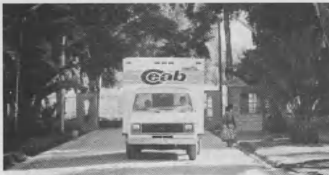
Lugar de Ingreso al CEAB, paso obligado para los estudiantes, profesores, visitantes y vehículos.