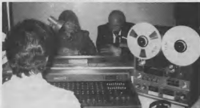
El presidente de la Unión Chilena, Pr. Elie Almonte, dedicando micrófonos y equipos en ocasión de la ceremonia inaugural del estudio de grabación.

Pre-trimestral. Es desbordante la alegría del Pr. Eleodoro Castillo al presenciar el creciente interés de las maestras para asistir a las reuniones en