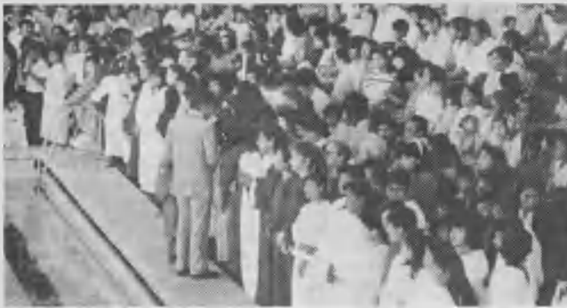
Los candidatos listos para entrar a las aguas bautismales en la piscina olímpica del estadio departamental Tahuichi Aguilera, Santa Cruz de la Sierra.

calidad humana: física, moral, intelectual y espiritual, de su personal y de su alumnado. Cada uno de ustedes es motivo especial de nuestro interés. Aquí tienen que surgir hombres y mujeres nuevos para Dios y la sociedad.