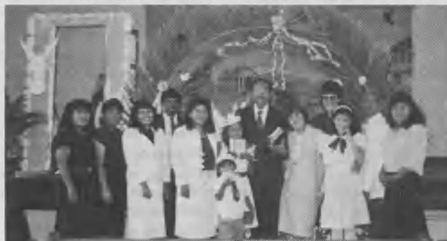
Algunos alumnos del Normal y profesores de la escuela primaria del CEAB junto al bautisterio al final de la semana de oración que tuvo como lema “Los niños son de Cristo”.