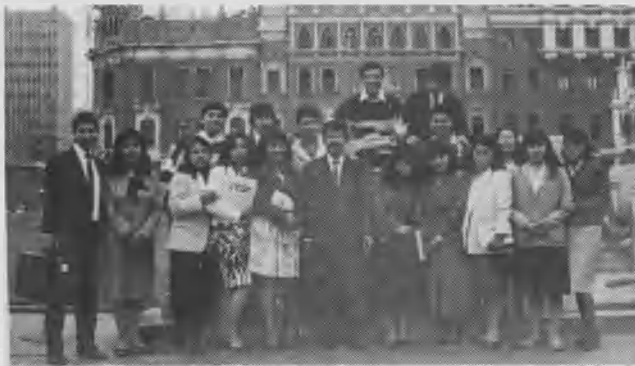
Grupo de jóvenes de la iglesia de Comas, después de la reunión realizada en el cine Metro como parte del V Congreso JA de la APC.

Además de este concilio de tesoreros, la Asociación Peruana Central (APC), organizó otros similares en Chimbote, para la zona norte, entre el 13 y 14 de julio; en Ica, para la zona sur, entre el 9 y 11 de agosto.