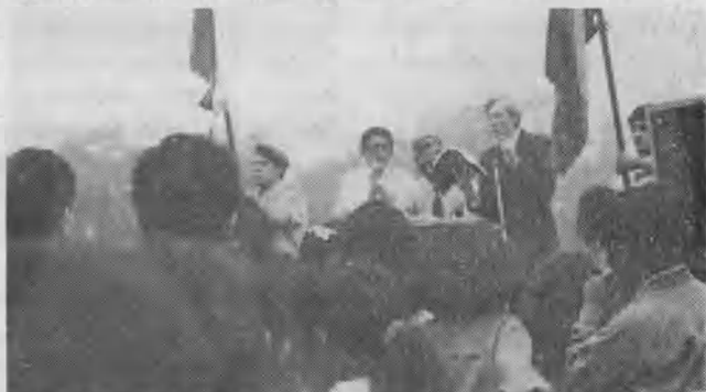
El Pr. John B. Taylor dirige la palabra en la ceremonia de colocación de la primera piedra del templo del CADE.

Pronto daremos informes de las campañas de evangelización en estas 2 ciudades, como un esfuerzo combinado de la DSA y de la ME.— En acción .