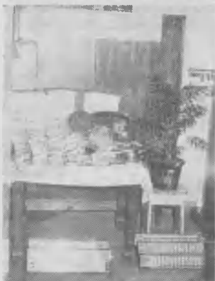
Parte de los utensillos de cocina que la Hna. Bernardita consiguió para instituciones de bien público.

sábanas, toallas, frazadas, muebles, medicamentos, y otros, por un importe de US$ 3.200.