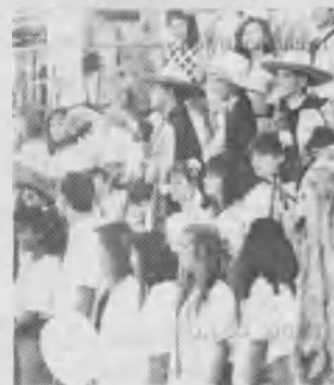
Jóvenes de la APC participan en el desfile.