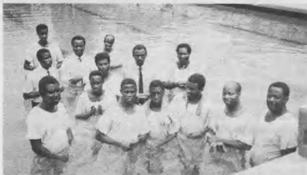
Parte de las casi 2.000 personas bautizadas en Ghana. Los bautisterios tuvieron que ser las piscinas públicas.

La campaña evangelizadora de Diepropetrovsk, Ucrania, con una asistencia promedio de 1.300 personas por noche, ya ha tenido el maravilloso bautismo de 465 personas; la de Rostov del Don, con una asistencia promedio de 5.000 personas por