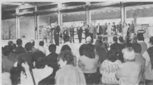
Vista parcial de la moderna estructura del depósito de Gránix.