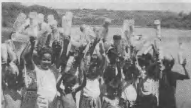
Niños de San Vicente, Misiones, levantan las botellas con el precioso contenido de impresos que hablan del mensaje adventista.