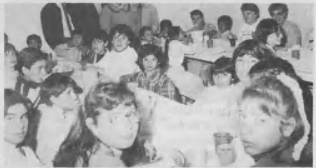
Los niños degustaron platos ricos y nutritivos preparados con mucho amor por las hermanas de OFASA en Venado Tuerto.

y nutritivo almuerzo vegetariano, que fue elogiado por los niños y por la nutricionista de la institución. Además se aprovechó la oportunidad para dar el mensaje adventista. Las 4 emisoras radiales y los 3 periódicos se hicieron eco de esta actividad de OFASA. De ese modo, no hubo persona que no se enterara de las actividades que realiza OFASA en la ciudad de Venado Tuerto.