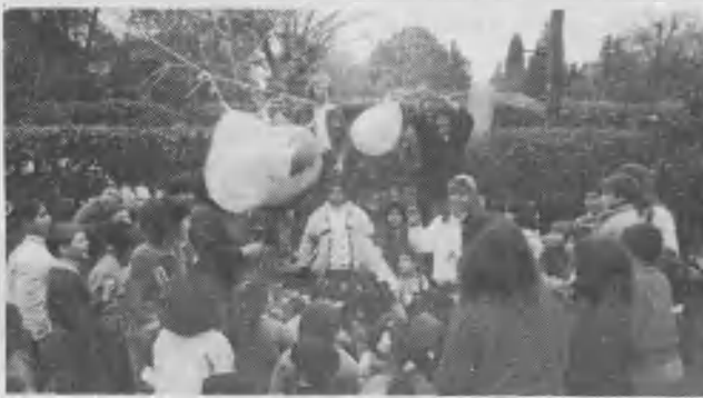
Los niños de San Miguel fueron muy felices en su día.

Entre otras actividades que se están realizando, podemos destacar la organización de almuerzos en las instituciones de bien público de la ciudad. En esta oportunidad, OFASA brindó un almuerzo a CANEA (La Casa del Niño). En esta entidad trabajan conocidos e influyentes profesionales de la ciudad, quienes destinan sus esfuerzos al servicio del niño discapacitado. Las hermanas de OFASA sirvieron un rico