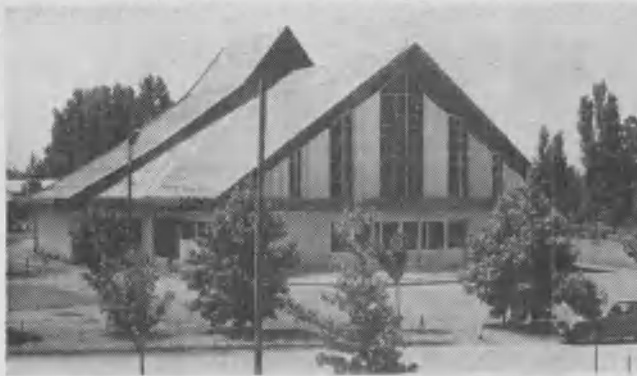
La capilla moderna de la UnACh en un punto céntrico del campus institucional.