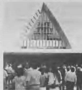
Fronte del flamante templo de Baradero, en la provincia de Buenos Aires.