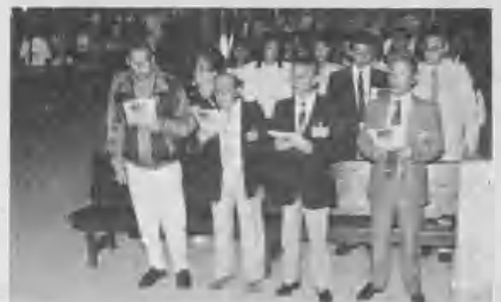
▶ Parte de los delegados del X Congreso de la Asoc. Central.