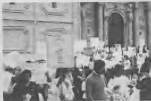
► Marcha de la esperanza por las calles de Santa Cruz, Bolivia.

rio. Sabemos que hay muchos miembros de iglesia que desean ingresar en la obra del colportaje. Los invitamos a aceptar el desafío. No se arrepentirán.