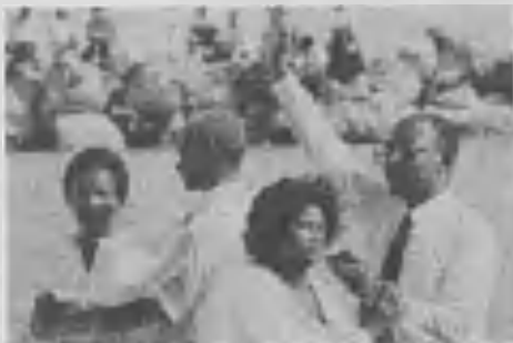
➤ Escena del gran bautismo Mega-Guatemala.

"La gran embestida comenzó en julio de 1990, en ocasión del último congreso de la Asoc-