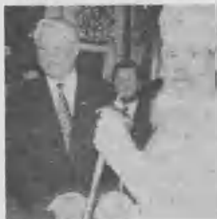
➤ Yeltsin intercambia un apretón de manos con Alexis II, patriarca de la Iglesia Ortodoxa Rusa.