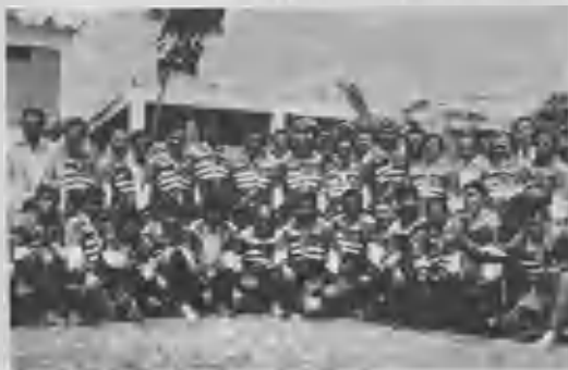
➤ Este no es un equipo de fútbol. Es el grupo evangelizador de la APC, que participó en el Pentecostés del 91.