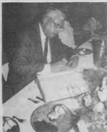
◀ El presidente de la AG firmando el libro de oro de la UAP.