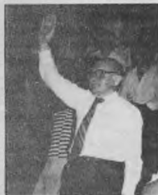
◀ Los mensajes del Pr. Folkenberg produjeron un gran efecto en los que ya están en la tercera edad.

1. Para mí, la visita del Pr. Folkenberg significó el encuentro con un hombre inspirador, que trajo la Palabra de Dios con un mensaje de luz y esperanza para su pueblo. Su venida reafirmó mi fe en esta iglesia.