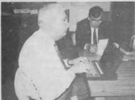
▶ El presidente de la AG registró en su computadora las declaraciones de la comisión interinstitucional sobre la proyectada carrera de medicina de la UAP.