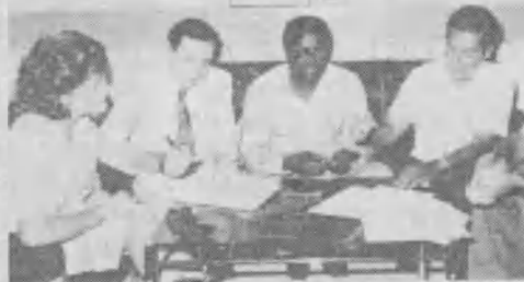
➤ Representantes de ADRA con autoridades de Jibuti acuerdan la construcción del primer edificio adventista en ese país.

■ Una preocupación. Las puertas pueden cerrarse también por el secularismo y el materialismo, o porque las fuerzas opuestas pueden llevar a ese cierre. Misión global llegó en el momento justo para movillar los recursos mundiales de la iglesia. Hoy es el tiempo de oportunidad. Mi preocupación es que las puertas que se abrieron se vuelvan a cerrar. Ya nos ocurrió en el Japón al finalizar la Segunda Guerra Mundial. Además, antes de la Segunda Guerra Mundial y de la Revolución Rusa, cada país tenía su iglesia estatal que, antes del comunismo, estaba acostumbrada a tener mucha influencia sobre el manejo del gobierno. Ya hay países donde es más difícil conseguir permiso para usar auditorios con fines religiosos, que durante el comunismo. Esta es otra de las fuerzas con capacidad para cerrar las puertas que se abren. Hoy es el tiempo. Llegó la hora cuando debemos unirnos para ejecutar la terminación de la obra. ¡El fin viene!