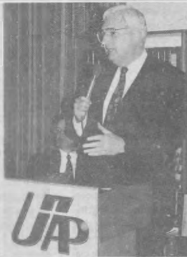
▶ El Pr. Folkenberg y contesta las preguntas de los representantes de numerosos medios de la región.