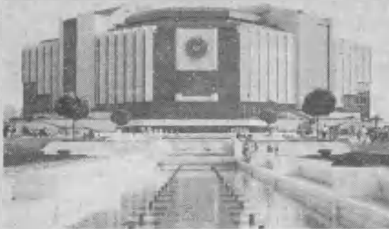
◀ El Palacio de Cultura en Sofía, Bulgaria, donde se han tenido importantes reuniones adventistas.