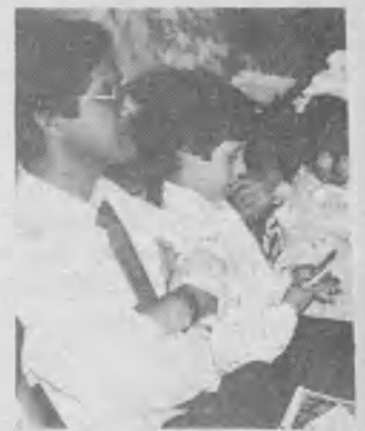
➤ Los niños tienen su lugar en el plan de Misión global.

RF: Las 27 que figuran en el Manual de la iglesia. Sin embargo, debíamos presentar el tema del santuario con el juicio investigador y las profecías distintivas, especialmente de los acontecimientos finales, para que la iglesia y el mundo pueda entender lo que está pasando a nuestro alrededor.