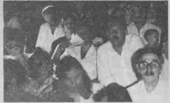
➤ Visita del presidente de la Asociación General: Los hechos en blanco y negro. Algunos comentarios en rojo.

■ Países musulmanes. Muchas situaciones son desafíos que Dios ha puesto en nuestras manos. Durante los últimos 18 meses hemos abierto obra en 3 nuevos países musulmanes: Somalia, Jibuti y Mauritania.