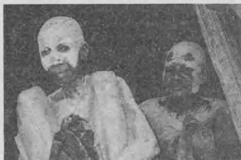
➤ En Papua-Nueva Guinea el evangelio cambia viejas costumbres, como ponerse pintura blanca en señal de duelo.

Hace unos meses, Anita y yo estuvimos en el Africa, en Zimbabwe (antigua Rhodesia).