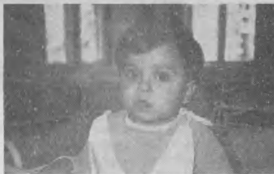
➤ Este es uno de los niños huérfanos atendidos por la Iglesia Adventista en Rumania.

edificio de 15 pisos, que comenzará a funcionar en Julio. Trabaja claramente en nombre de la Iglesia Adventista y con una misión evangelizadora. Debemos dar gracias a Dios por eso.