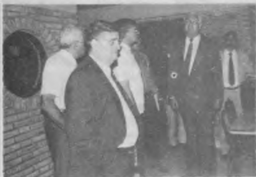
▶ Admirando el nuevo salón comedor para pacientes del SAP.