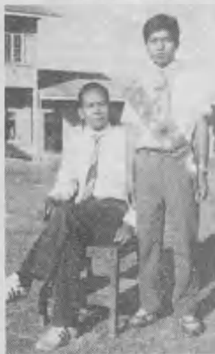
➤ El Pr. Rual Chhina, dirigente de la Unión Birmana (sur de China), con un conquistador.

En Papua-Nueva Guinea el 25% de la población es adventista. También es adventista el 25% de los miembros del Congreso y del gabinete nacional.