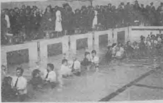
◀ Uno de los tantos bautismos masivos que se están realizando en Rusia.