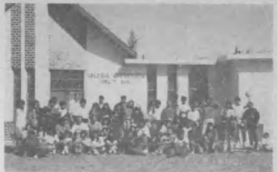
▶ Jóvenes de las iglesias de Comodoro Rivadavia y Caleta Olivia en el frente de la iglesia, al salir al lugar del retiro espiritual.

presentes en la primera noche del ciclo, de conferencias.