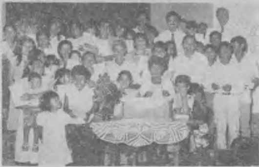
◀ Parte de los 44 hermanos bautizados como resultado del ciclo de conferencias en Orán, Salta.