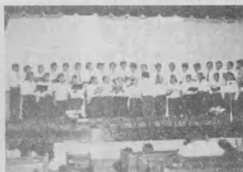
➤ Alumnos del curso de música para laicos formaron un coro para el programa de clausura del 3º ciclo de verano.