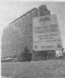
El hotel Sheraton fue el lugar donde se realizó el congreso de tabaco.

Todo el esfuerzo realizado se vio coronado cuando en el discurso de clausura, el Dr. José