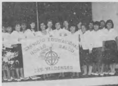
➤ "Las Valdenses", un grupo de 20 colportoras que trabajaron en Chosica durante 45 días.

zó una marcha de temperancia en el aniversario de la Prov. de Rioja, actividad que mereció el aplauso del público y de las autoridades gratamente impresionados porque en medio de tanta corrupción y vicios hay una juventud vibrante que proclama los valores cristianos.