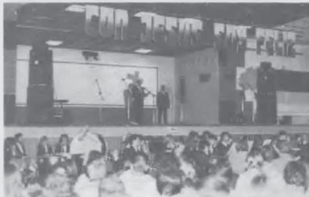
Primer congreso de jóvenes de la AAC. Asistieron 750 jóvenes.

■ Agosto 28-30. Encuentro universitario. Se realizó en Embalse de Río II, a 90 km de Córdoba, y asistieron 150 estudiantes de las 7 provincias de la asociación.