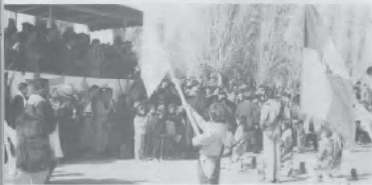
Desfile de los conquistadores del Club Aconcagua, Mendoza, en ocasión de la celebración del 9 de julio.

■ La Voz de la juventud. Se realizaron 18 proyectos misioneros durante 1992. Conquistadores, miembros de la Sociedad de Jóvenes y universitarios se unieron en una tarea que trajo nada menos que 200 almas a los pies de Jesús.