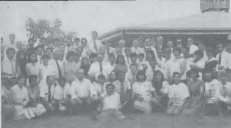
Los colportores de la UA que se reunieron en San Bernardino, Paraguay, para celebrar su asamblea anual.