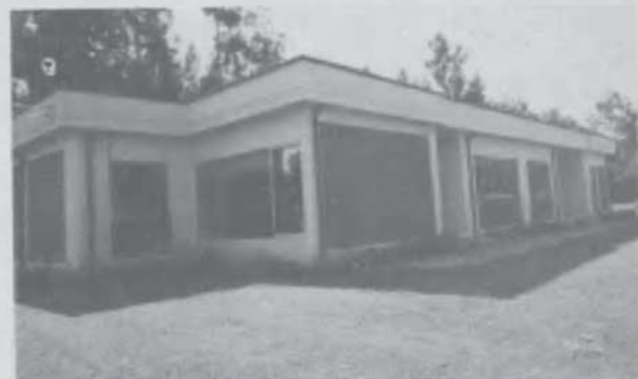
El edificio donde funciona la emisora.

Confiamos que toda esta infraestructura está siendo utilizada por maestros que tienen la misión de impartir a los alumnos el espíritu de los pioneros para que cuando ellos dejen el aula y las ondas se difundan por el aire, la gente que los escucha descubra que tienen lo que nadie les ha ofrecido: el testimonio de una vida transformada por el poder del evangelio. La bendición mencionada nos permite servir al prójimo con dedicación y disfrutar la vida en plenitud. ¡Eso es vivir en Cristo!