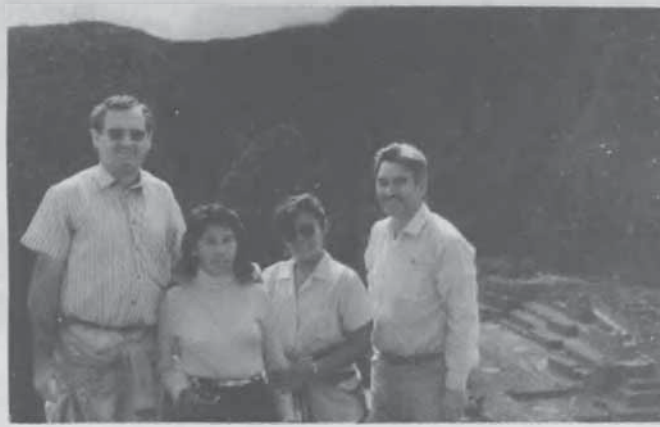
En Machupicchu, paréntesis de una asamblea de colportaje de la UI realizada en la ciudad del Cuzco.

En Sembrador Incaico , boletín del departamento de Publicaciones de la UI, damos