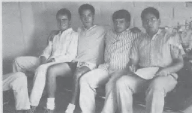
El equipo que trabaja en la estación transmisora.

Una de las fórmulas que le ha dado al movimiento adventista la pujanza que tiene es la estrategia “de todas partes para todas partes”. El congregacionalismo debilitó a muchos movimientos evangélicos al dejar que cada iglesia luche sola por su propio desarrollo, sin tomar en cuenta la necesidad de otras congregaciones de su propia denominación.