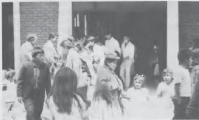
La iglesia Ebenezer de La Licenciada, el día de su inauguración.