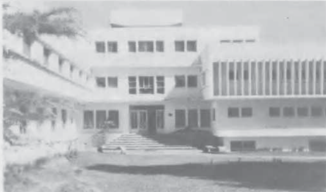
Hogar de varones en la UAP, completamente renovado.

■ Nuevo régimen habitacional. A partir de 1993, los alumnos del nivel superior pueden alquilar suites con comodidad para una y hasta 4 personas, con una sala de estudios para 1 y hasta 3 personas. La universidad provee escritorio, electricidad permanente,