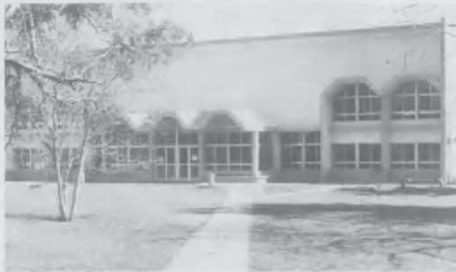
El Comedor, totalmente remodelado, es un lugar donde los jóvenes se alimentan física y socialmente.

■ Segundas Jornadas de Integración Psicológica. El 23 y 24 de setiembre del año en curso se realizarán en la UAP las Segundas jornadas de