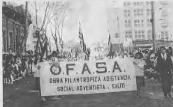
Las Dorcas destilando por las calles de Salto.

El departamento de Dorcas de la iglesia de Salto, Uruguay, está muy activo para equipar más el taller y mejorar el lugar en el cual trabajan con el propósito de