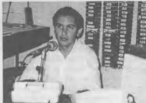
Estudio de una de las 6 emisoras con que ahora cuenta la iglesia para difundir el mensaje.