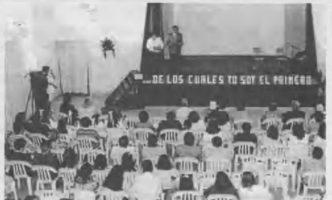
Los esposos Castro testificando durante la ceremonia de lanzamiento del libro.