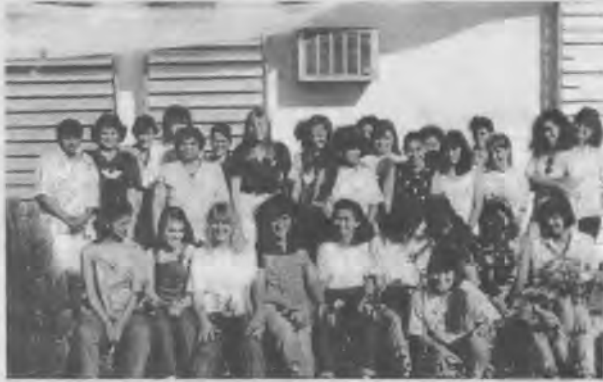
Participantes del curso de cocina vegetariana realizado en Oberá.