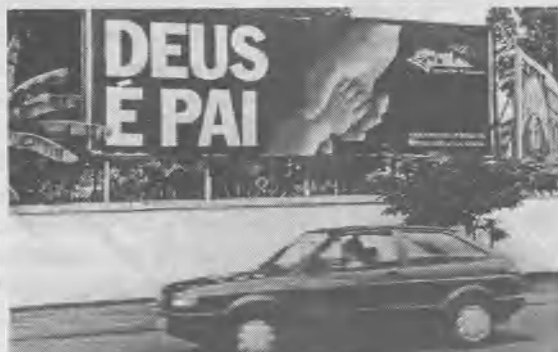
La publicidad que cosechó elogios.

Este programa estuvo destinado a apoyar en forma significativa las acciones que realiza el Comité de Acción Ciudadana contra el Hambre. El plan de la iglesia contó con el apoyo del gobernador del Estado de Pará, los supermercados, el cuerpo de bomberos, la policía militar, grandes compañías como Texaco, las principales entidades bancarias y prácticamente todos los medios de comunicación.