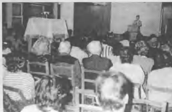
Vista parcial de los que asistieron al seminario en Colonia Valdense.

Las reuniones se celebraron desde el 30 de abril hasta el 28 de mayo de este año en el ex Hotel Brisas del Plata, cuyo dueño puso a disposición de la iglesia el salón auditorio al que concurrió