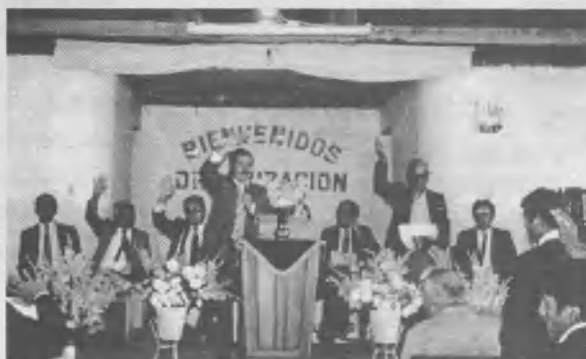
Ceremonia de la organización de la iglesia de Lazarte.

Como resultado de la visita que hizo por cada uno los departamentos del CAT, el Ing. Fujimori quedó tan impresionado por el enfoque formativo de la educación adventista que prometió obsequiar una serie de elementos que necesita la institución, entre las que se destacan, entre otros, un ómnibus, un camión, un tractor, maquinaria para la carpintería, un módulo avanzado para el laboratorio de biología y física, 15 computadoras, 180 máquinas —para compartir con el resto de las escuelas adventistas del departamento de Puno—, una lavadora industrial, un torno mecánico y 13.000 árboles.