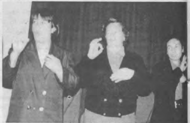
Algunos de los minusválidos cantando una melodía preferida.