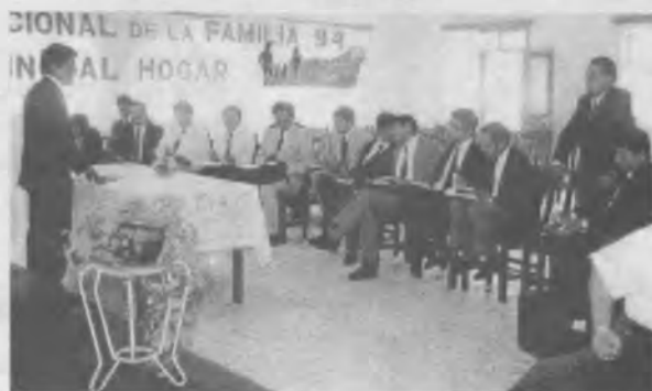
Pastores de la MOB estudiando el asunto de los seminarios para fortalecer a la familia.

do la presencia de Dios y las bendiciones del Altísimo para el ilustre visitante. Al hacer uso de la palabra, el Presidente alentó a los educadores adventistas para que "sigan manteniendo muy en alto los valores ético-morales que contribuyen a la formación de una juventud sana cuyo aporte la Patria necesita".