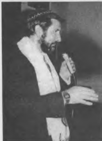
Un judío testifica acerca de su fe en Cristo.

El encuentro fue presidido por el Pr. Eliel Almonte, presi-