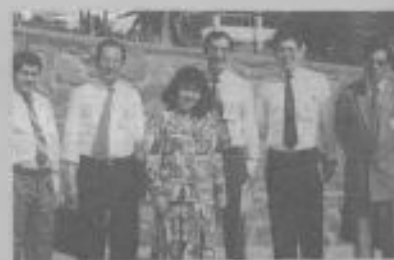
DELEGACION de la Misión del Lago Titicaca.

Dada la trascendencia de la convocatoria, asistieron y participaron activamente