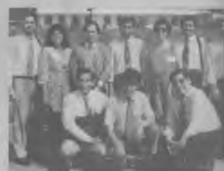
DELEGACION de la Misión de Oriente Boliviano.

presencia del Señor y la manifestación de madurez de los hermanos". Haciendo referencia a las perspectivas que se le abren al tener que administrar un territorio más reducido, agregó: "De las experiencias vividas, saquemos las mejores enseñanzas a fin de ponerle más sustancia a nuestras predicaciones. Pastores y feligreses, procedamos a ofrecerle