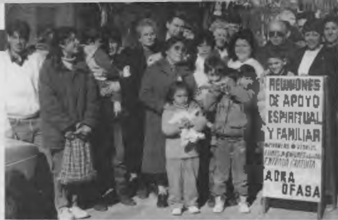
Aunque la tragedia les hizo perder casi todo, ya sea material y espiritualmente, estos creyentes ahora se gozan al haber conquistado otros valores, y especialmente por el privilegio de formar parte del pueblo de Dios.