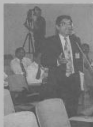
LOS DELEGADOS participan.