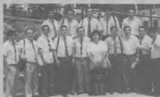
DELEGACION de la Misión Peruana del Norte.