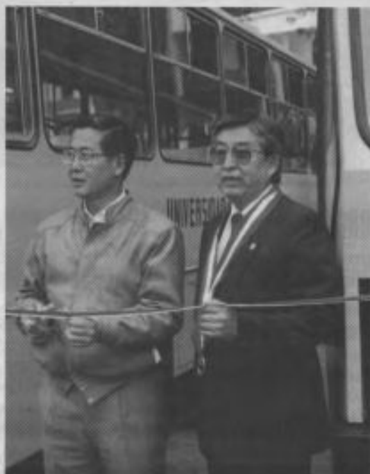
A la izquierda, y tijera en mano, el Ing. Fujimori está listo para cortar la cinta roja y blanca. Lo acompaña el con- decorado rector de la UII.