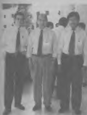
DELEGACION del Centro Educativo Adventista de Bolivia.