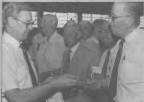
LOS HERMANOS recibieron un diploma de reconocimiento por las contribuciones hechas en favor del movimiento adventista.

Ministerio Personal y Escuela Sabática. Aunque ya forma parte del equipo de la DSA, el Pr. René Sand dio a conocer una de las actividades que impulsó: "Durante el quinquenio crecieron mucho los festivales de siembra y cosecha. En los lugares donde se realizaron estos programas se produjo un reavivamiento muy interesante".