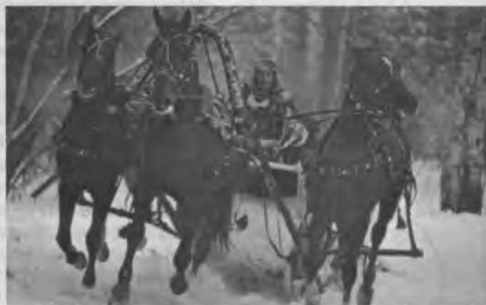
En la Siberia rusa, el misionero irineo acompañado por tres mullos.

"En Siberia —termina diciendo el Pr Zawadzki— los mártires realizaron la sumbra en forma silenciosa. Hoy estos jóvenes llenos de santo valor y coraje están dispuestos a terminar la obra que aquellos comenzaron".