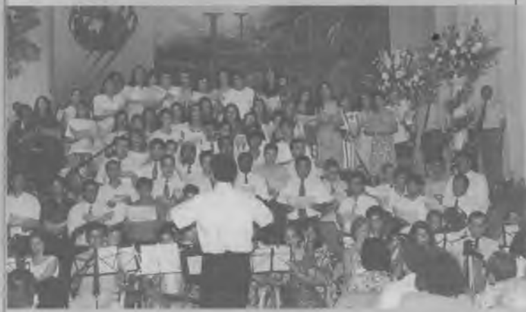
GRAN FINAL del congreso al son de una tradicional melodía que inspiró a los delegados a salir a participar en la misión final.

"Al comienzo del quinquenio otros iniciaron la siembra cuyos frutos trajimos para presentarlos al Señor. En lo que nos resta por hacer, Unidos en Cristo salgamos a terminar la obra encomendada a su pueblo. Por lo tanto, comprometámonos a seguir avanzando por la fe y manteniendo a nuestro Comandante siempre al frente de nosotros, a fin de que nos lleve al triunfo final".—WERMA.