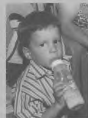
HUBO bastante alimento espiritual para todos, bautismos a los niños en la búsqueda de la comedia que permanezca.

Secretaría. Aunque la apostasia ha ido disminuyendo en forma significativa —actualmente es del 39,6%—, el Pr. Aníbal Espada desafió a "estudiar planes destinados a inte-