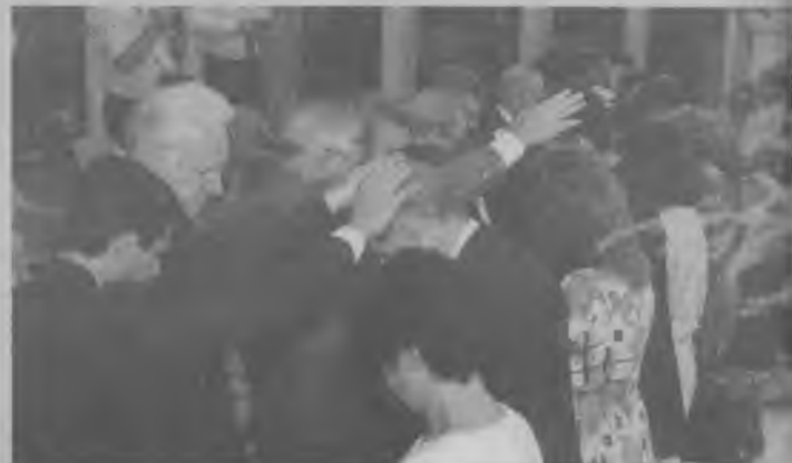
LA ORDENACIÓN de seis siervos apartados para el campo misionero en el área de la predicación, la salud y la docencia.