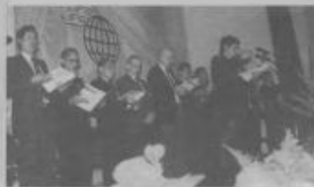
ADMINISTRADORES de la DSA y de los territorios dependientes de la UA presidiendo las correspondientes delegaciones al congreso.

tarán hispanohablante de la DSA, realización que le dio una dimensión histórica al referido congreso.