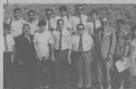
DELEGACION de la Misión Boliviana Occidental.

El VIII Congreso de la Asociación Peruana Central, celebrado el día 3 de enero, procedió a hacer oficial la división de su territorio, reestructuración que resultó en la organiza-