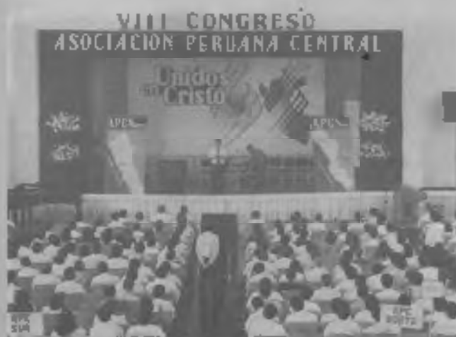
EN OCASION del VIII Congreso se divide la Asociación Peruana Central.