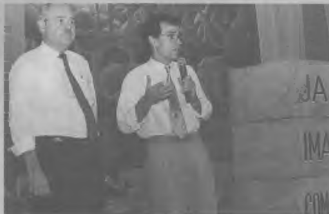
QUE CADA CREYENTE e institución tenga su Gégal para oír la voz del testimonio acerca de lo que Dios hace por nosotros.