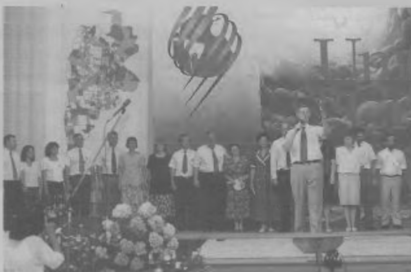
ADMINISTRADORES Y DIRECTORES de departamentos renuevan su consagración por su respuesta al desafío que les confió la iglesia.

Nota: Los directores de las instituciones y otras funciones administrativas son nombradas por la junta directiva de la UA.