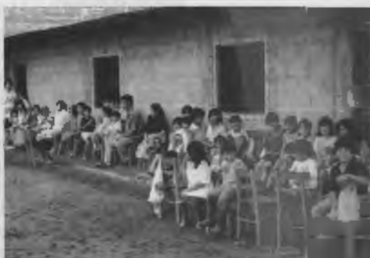
En Resistencia, estos niños esperaban el momento de recibir el ansiado alimento que les ofrece la iglesia.