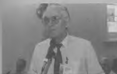
HUBO mucha participación en los asuntos que fueron sometidos a la consideración del congreso.