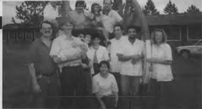
Parte del personal del SAH al costado del parque del sanatorio.

de enseñar, sanar y predicar. Y dondequiera que ya estén establecidas, que sus miembros realicen acciones conjuntas para el propio crecimiento de las participantes y para beneficio de las que aún no conocen a Cristo.