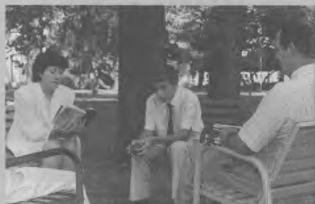
HASTA LOS PARQUES fueron lugares apropiados para cultivar los valores espirituales estimulados por el congreso.

Centenas de asistentes —entre delegados, parientes y vecinos— colmaron el auditorio de la Universidad Adventista del Plata (UAP), con el fin de participar en el programa inaugural del XXVII Congreso de la Unión Austral cuya celebración comenzó el 24 y finalizó al atardecer del 27 de enero. El lema escogido para la ocasión fue: Unidos en Cristo .