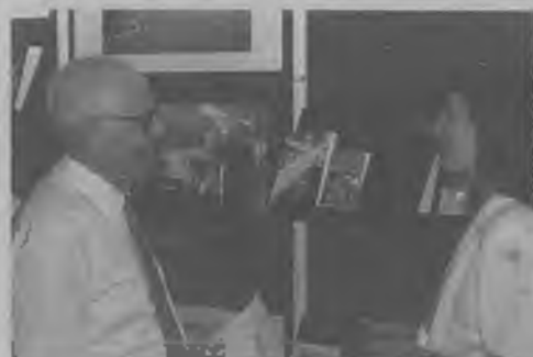
LA EDITORIAL de la Iglesia presentó las obras publicadas durante 1995 y también las primeras de 1996.

Comunicación, Radio, TV. "Realizamos el mayor proyecto editorial: la preparación y difusión de un suplemento que llegó al público mediante los principales pe-