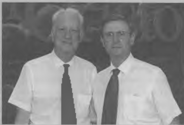
ESCOGIDOS por sus correspondientes congresos, presidentes de la DSA y la UA se juntan para trabajar unidos en Misión global 2000.

que la iglesia del presente y del futuro pueda saber que, en forma semejante a lo que ocurrió en la ason del cruce del Jordán, Dios también estuvo con su pueblo durante el quinquenio que finalizó