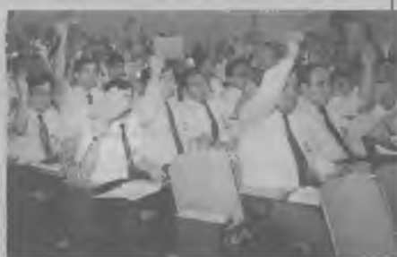
ACTIVA participación de los delegados.