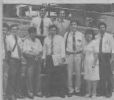
DELEGACION de la Unión Boliviana.

multiplicar, crecer para preparar el camino del Señor, debe ser la enseñanza sacrosanta del movimiento adventista.