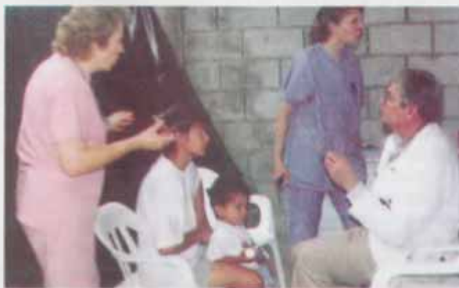
Médicos de la Universidad de Loma Linda atienden a pacientes en un improvisado consultorio.

El grupo que viajó desde los Estados Unidos, además de atender a más de 600 pacientes, también participó activamente en el desarrollo del proyecto destinado a terminar un Dispensario Médico Adventista que prestará servicios en el sector sur de la ciudad de Guayaquil.