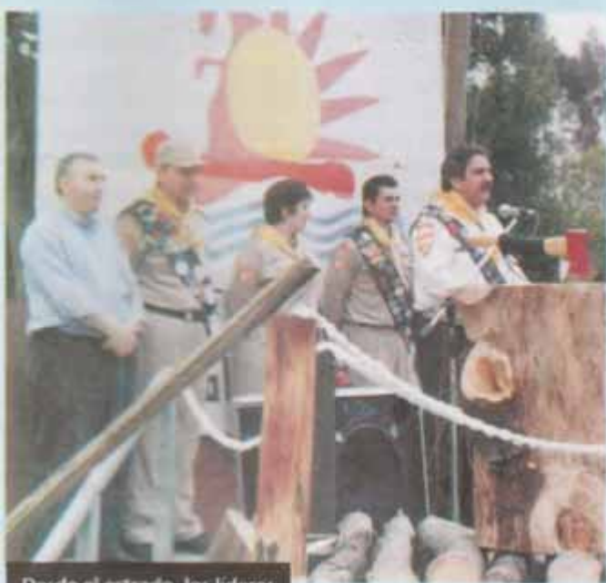
Desde el estrado, los líderes exhortaron a la juventud a experimentar sus convicciones.

A mediados del mes de octubre del año pasado, más de 700 jóvenes de la Asociación Bonaerense (ABO) participaron en un camporí que se realizó en la zona de Mar del Plata.