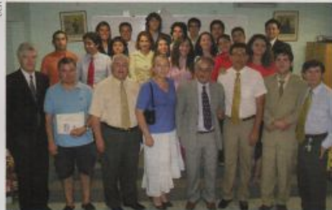
Docentes y alumnos de la escuela de verano para sordos.

Este proyecto, que contó con la participación de 26 alumnos sordos de entre 18 y 24 años, fue financiado por ADRA, en conjunto con la Asociación Metropolitana de Chile, iniciativa que persigue integrar a este grupo de personas a la educación adventista. Las mate-