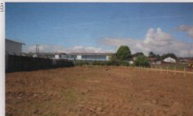
Terranos sobre los que se edificarán las nuevas instalaciones.

La MACH, entonces, tendrá sus cuatro colegios funcionando en la modalidad de Jornada Escolar Completa (JEC).