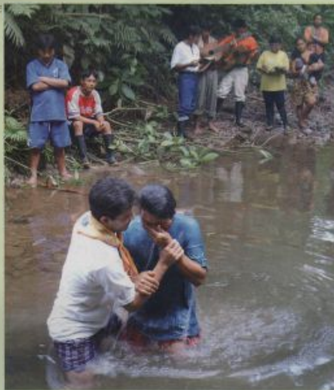
Representantes de ADRA entregan un generador eléctrico y material audiovisual para evangelismo (fotos a la izquierda), y bautismo de shuaras en un río tarraíai.