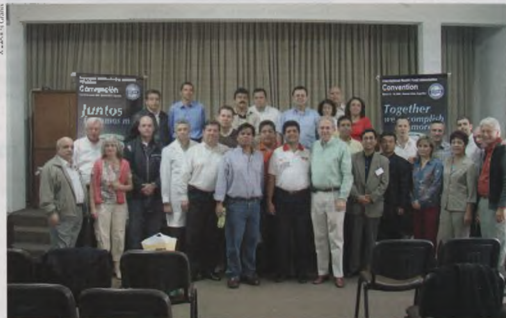
Asistentes a la convención de IHFA.