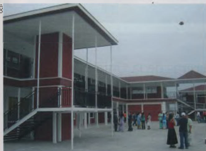
Colegio de Arica.

Con este paso, la MNCI completa la instalación de distritos de colegio en la totalidad de sus establecimientos educacionales: un plan que, se cree, redundará en grandes bendiciones para el avance del evangelismo en las instituciones.