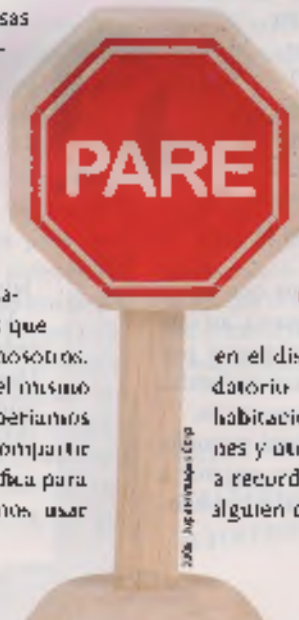
2008, Agencias Ciep

Oriente a los niños en el diseño de un afiche recordatorio que colocarán en sus habitaciones. Utilicen ilustraciones y otras cosas que los ayuden a recordar que deben hablarle a alguien de Jesús cada día.