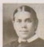
ELENA DE WHITE fue mensajera del Señor.

Pero Jesús dijo que, antes de que él venga, "Y será predicado este evangelio del reino en todo el mundo, para testimonio a todas las naciones, y entonces vendrá el fin" (Mat. 24:14). Su Reino no vendrá hasta que las mareas de su gracia sean llevadas a toda la tierra. Cuando nos entreeguemos a Dios y conduzcamos a otras almas a él, podremos acelerar el advenimiento de su Reino. Solamente aquellos que se consagran a su servicio, diciendo: "¡Heme aquí, envíame a mí!" (Isa. 6:8), "para que abras sus ojos, para que se conviertan de las tinieblas a la luz, y de la potestad de Satanás a Dios; para que reciban, por la fe que es en mí, perdón de pecados y herencia entre los santificados" (Hech. 26:18), solamente ellos ruegan con sinceridad "Venga tu reino" (Mat. 6:10).—Elena G. de White, The Advent Review and Sabbath Herald (14 de noviembre de 1912). —