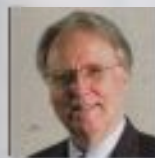
JAN PAULSEN , presidente de la Asociación General de la Iglesia Adventista del Séptimo Día