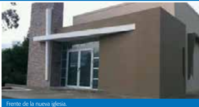
Frente de la nueva iglesia.

Actualmente, se están trazando grandes planes de evangelismo para la pequeña ciudad de