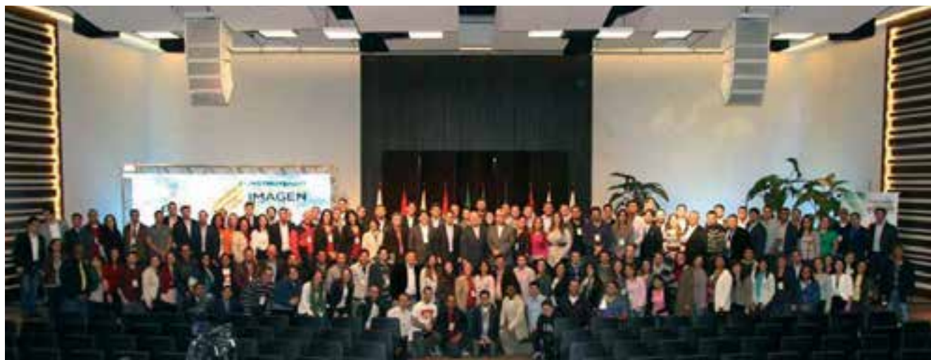
Participantes del Encuentro de Comunicación de la DSA y GAIN 2013.

Los eventos contaron con visitas importantes a nivel eclesiástico y con panelistas