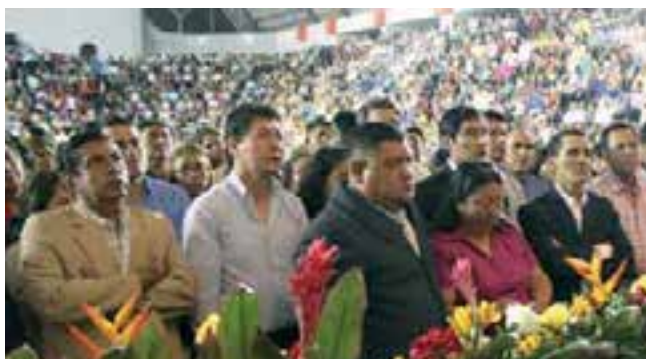
En Ecuador, toda la iglesia está identificada con el Evangelismo Integral.