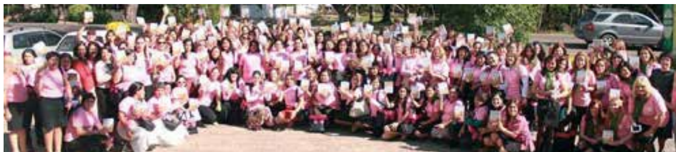
Las mujeres de la UP salieron renovadas y fortalecidas luego de este encuentro.

En este congreso se vivió una extrema comunión con Dios. En un momento de la programación, se llevó a cabo un emotivo bautismo en donde entregaron su vida a Jesús dos valientes mujeres.