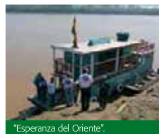
“Esperanza del Oriente”.