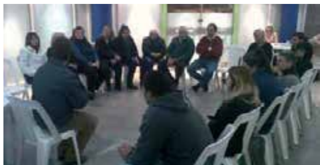
Mediante los Centros de Influencia, la iglesia busca posicionarse en la sociedad.

-En el restaurante Granix : se dictaron tres cursos de control del estrés. Asistieron 76 personas y se mantiene el contacto con 32 de ellas.