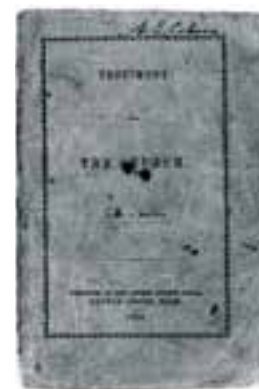
Portada del primer ejemplar. Tenía 16 páginas y fue publicado en 1855.

Siguiendo este comienzo modesto, fueron apareciendo con el tiempo más panfletos con testimonios para la iglesia. Diez fueron enviados entre los años 1855 y 1864. Cada testimonio fue numerado consecutivamente a medida que eran publicados, y estos números han perdido y figuran en nuestra serie actual de