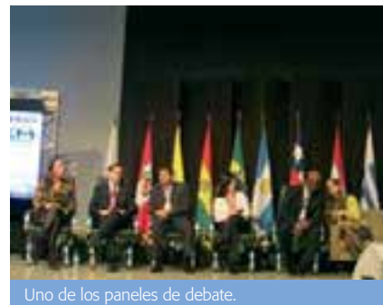
Uno de los paneles de debate.

Más allá de todo esto, el foco central estuvo en cómo motivar a la iglesia para