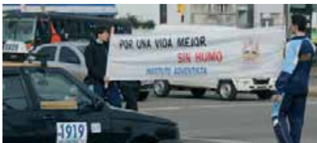
Hay que testificar de todas las maneras para atraer a las almas hacia la verdad.