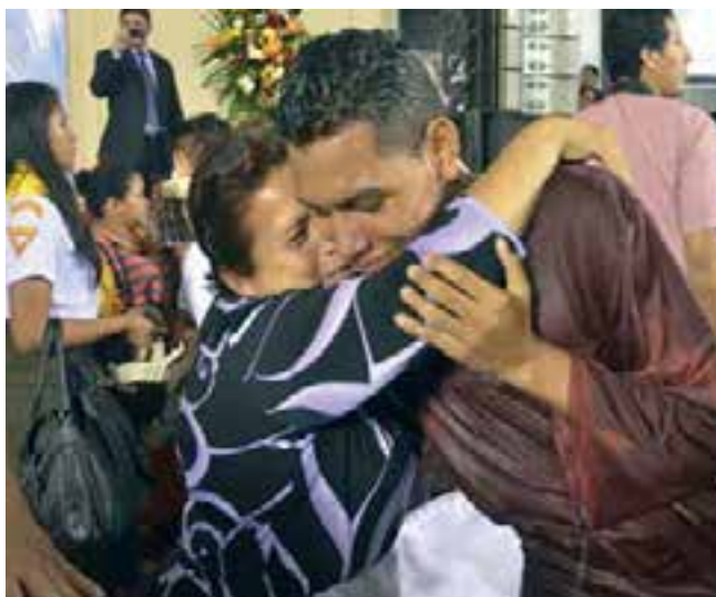
Momento feliz: los recién bautizados reciben el afecto de sus familiares y amigos.

“En Ecuador el Espíritu de Dios está tocando la vida de las personas y seguiremos avanzando con fe, llevando el mensaje de salvación. No podemos parar, ni callar estas verdades maravillosas que cambian vidas. Continuaremos predicando la Palabra de Dios con el mismo afán, desde los diferentes ministerios e instituciones de nuestra iglesia para que Cristo vuelva pronto”, expresó el Pr. Leonel Lozano, presidente de la Iglesia Adventista en Ecuador.