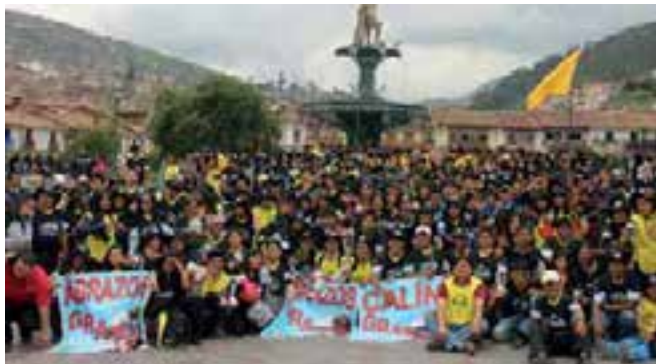
Una postal: miles de Jóvenes Adventistas participaron de Caleb 5.0.