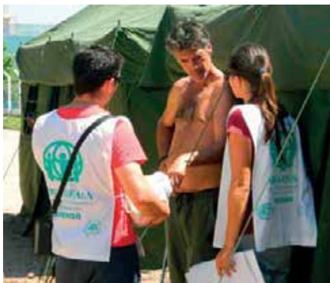
ADRA, siempre presente cuando las personas más lo necesitan.