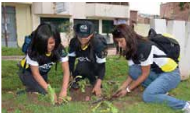
Cuidar la naturaleza es una consigna clara para los Calebs.

El despliegue de los jóvenes causó tal impacto en los pobladores y autoridades distritales, quienes reconocieron y el trabajo desarrollado en estas seis ciudades del Perú y los felicitaron por ello. “Gra-