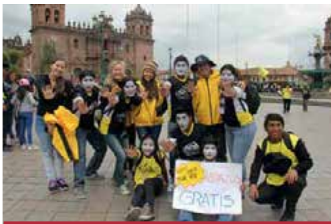
Con calidez y alegría, los Calebs recorrieron calles y plazas ofreciendo abrazos.

cias por su tiempo dedicado para realizar estos trabajos de ayuda social, ojalá otros jóvenes estén dispuestos a servir como ustedes lo hacen”, expresó Edwin Lizarbe, gerente municipal de Yarinacha (Pucallpa).