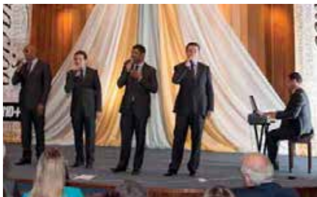
Cuarteto Arautos do Rei, cantando en la Iglesia Adventista de Florida.