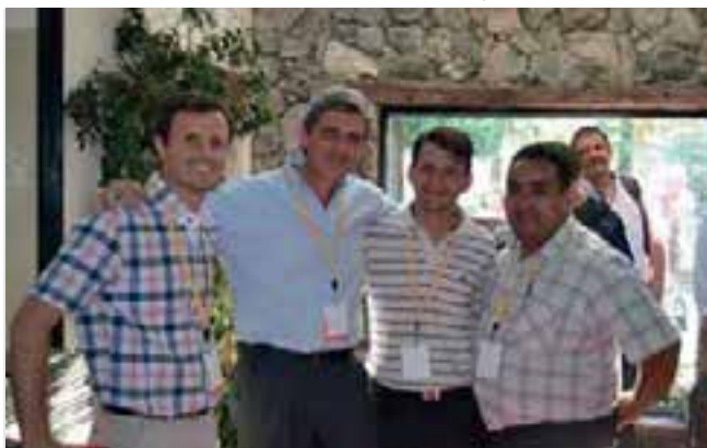
Felices, un grupo de pastores de la AAC disfruta del congreso.

Femenina del Área Ministerial y Ministerio de la Mujer.