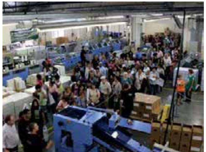
Hermanos y amigos visitan los talleres gráficos de la ACES.

coordinadores de Publicaciones estuvieron presentes.