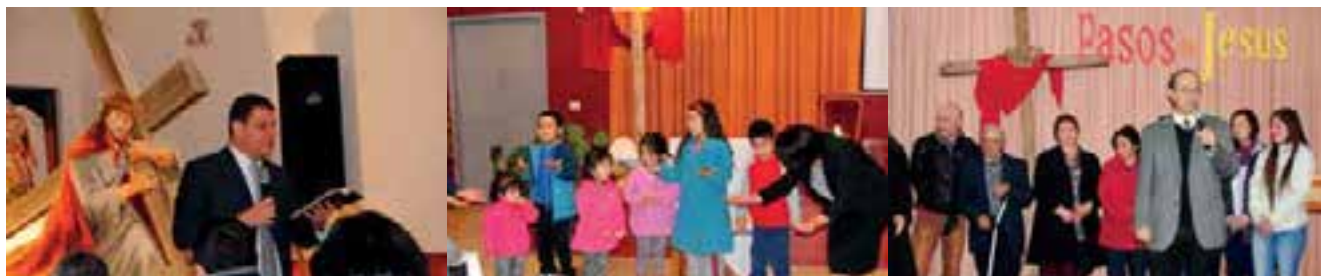
Imágenes de las distintas reuniones llevadas a cabo en todo el país.

le, quien estuvo como orador en una iglesia de Pitrufrquén, agradeció el esfuerzo de cada pastor distrital, de los administradores, de los directores de departamentos y de cada líder de iglesia que se involucraron al estar esta semana invitando gente, abriendo las iglesias cada noche y apoyando los centros de predicación. “Una semana de evangelismo reaviva a la iglesia, une los departamentos en una misma dirección”, mencionó.