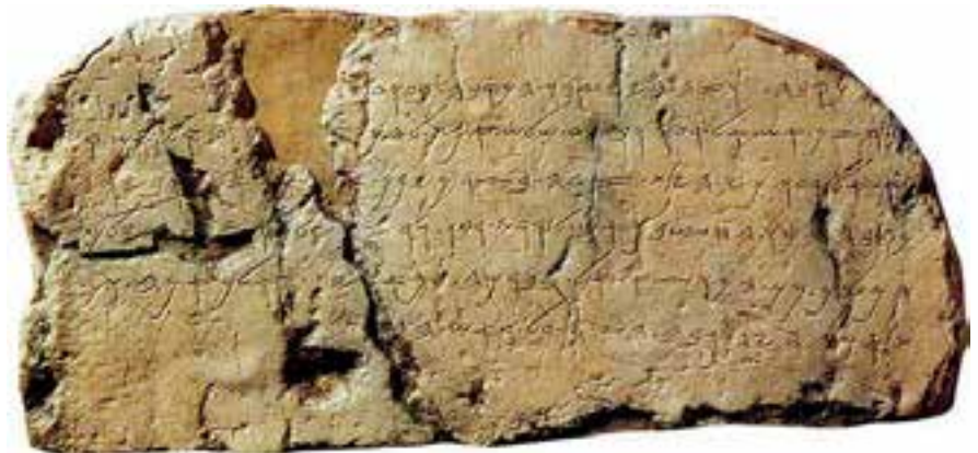
Inscripción de Siloé (Museo Arqueológico de Estambul, Turquía).

1 G. E. Wright, Arqueología bíblica (Madrid: Ediciones Cristiandad, 1975), p. 248.