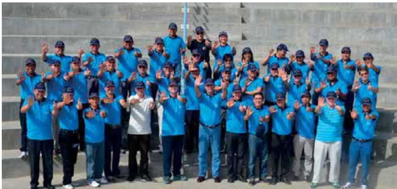
Líderes de la DSA y la UPN, comprometidos con la misión.

Desde el miércoles 16 de abril, los templos adventistas fueron abiertos para recibir a