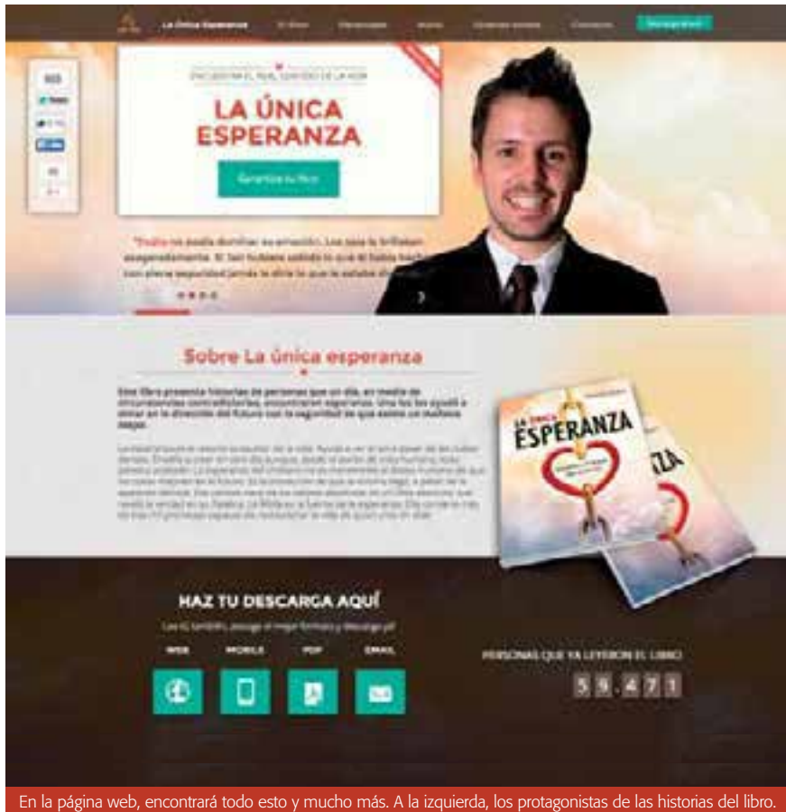
En la página web, encontrará todo esto y mucho más. A la izquierda, los protagonistas de las historias del libro.

que, de repente, se encontraron con la Palabra de Dios", sostiene el Pr. Bullón.