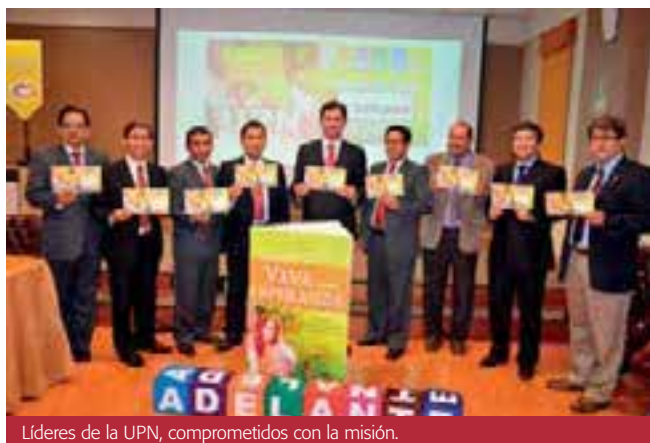
Líderes de la UPN, comprometidos con la misión.

Al finalizar el compromiso, como prueba tangible de ello, cada líder de los campos misioneros e instituciones firmaron