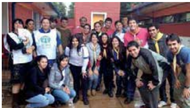
Jóvenes adventistas, ADRA y Conquistadores: siempre dispuestos para servir.

El programa ColportAR es una iniciativa del Departamento de Publicaciones de la Unión Argentina que nuclea a colportores y pastores con el objetivo de trabajar unidos para colaborar con un proyecto de establecimiento de un nuevo templo en cada Asociación o Misión. Muchos de los hermanos beneficiados con