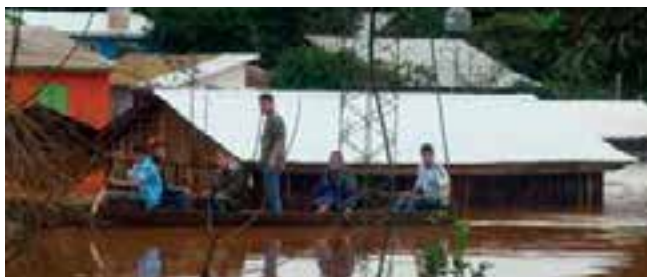
Una postal de la grave situación que atravesaron cientos de personas.

los recursos para la construcción de su templo, también se involucran acompañando a colportores