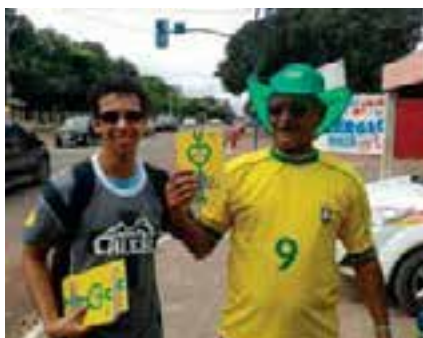
Un Mundial, un libro, una esperanza.