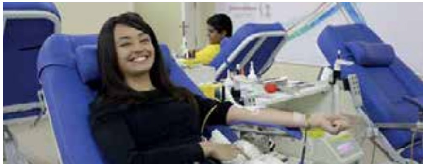
Como iglesia, debemos estar preparados para servir y darnos a conocer en este tipo de eventos masivos.