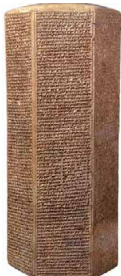
El “Prisma de Taylor”, que contiene referencias a Ezequías y a Jerusalén.

la posteridad la historia de una epidemia que impidió que su ejército completara una conquista. Pero note que no dice haber invadido Jerusalén. Solamente menciona que confinó a su rey dentro de la ciudad. RA