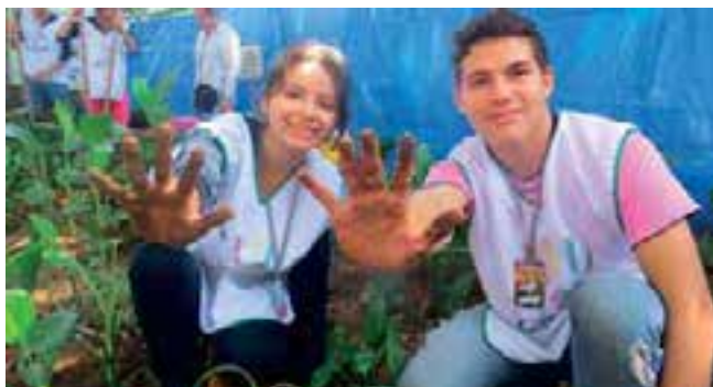
Los jóvenes Caleb brindan un gran testimonio a cada lugar donde van.

Además, los jóvenes realizaron actividades comunitarias en coordinación con las Juntas