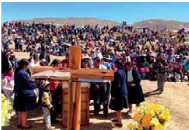
Emotivos momentos de esta caravana que condujo a miles a los pies de Cristo.