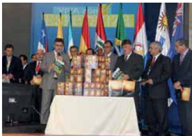
Dedicación del kit de libros “Mensajeros de esperanza”.