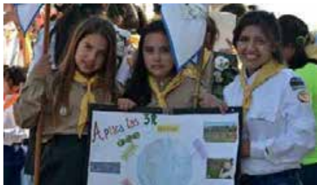
Los Conquistadores siempre están alegres y tienen un espíritu de servicio.

Si hay un punto para destacar de estos eventos es el momento espiritual. Todos los eventos giraron alrededor de las medita-