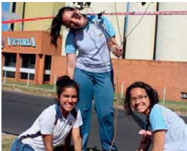
Cuidar la naturaleza, un compromiso de los alumnos adventistas.