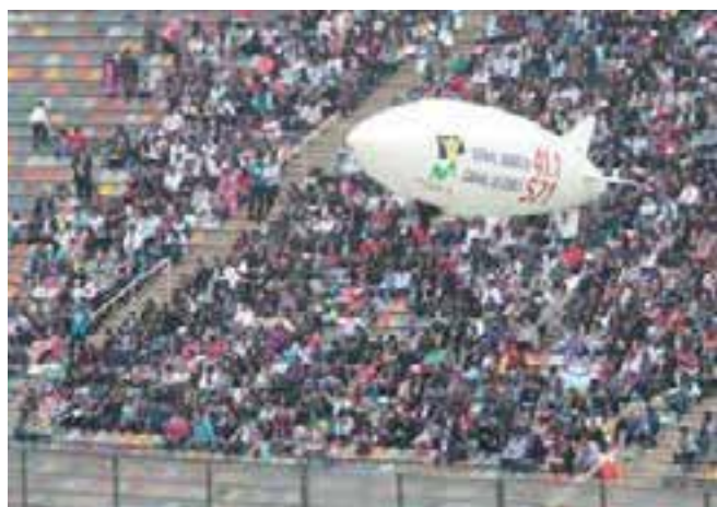
Las nuevas frecuencias ya están en el aire.