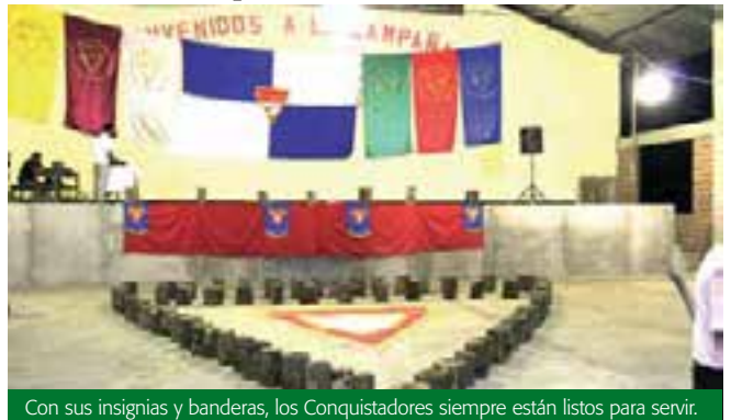
Con sus insignias y banderas, los Conquistadores siempre están listos para servir.

El evento fue un éxito, a pesar de la lluvia; los Conquis-