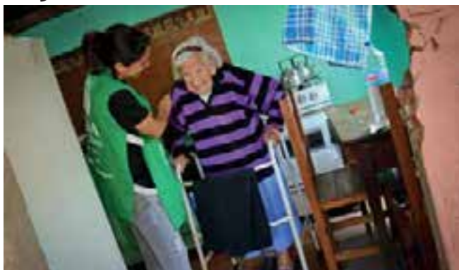
Una voluntaria de ADRA, ayudando a una anciana afectada.