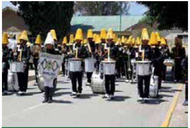
Uno de los momentos de las celebraciones por este nuevo aniversario.