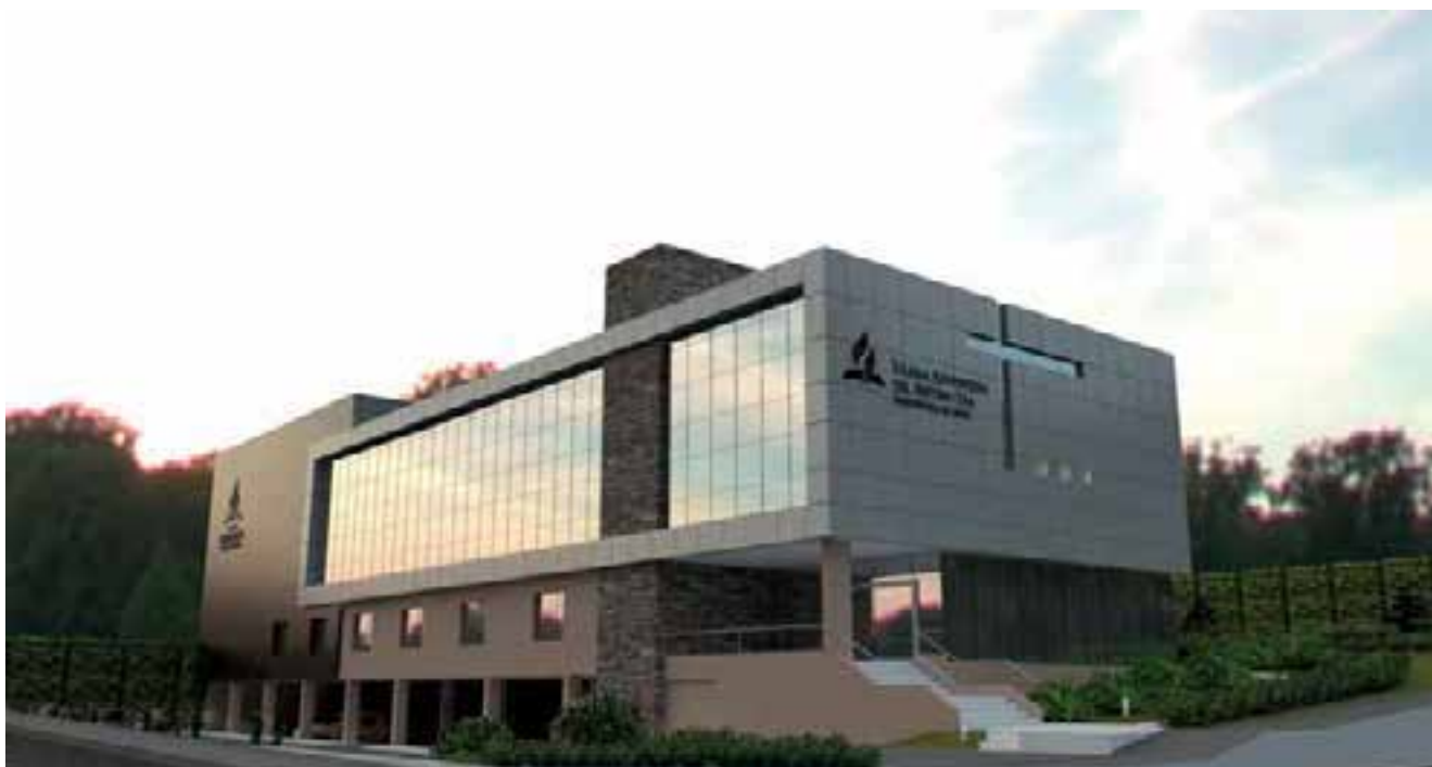
El edificio de la nueva sede.

La UPN administra congregaciones con cerca de 205.000 miembros adventistas y fue creada en 2006.