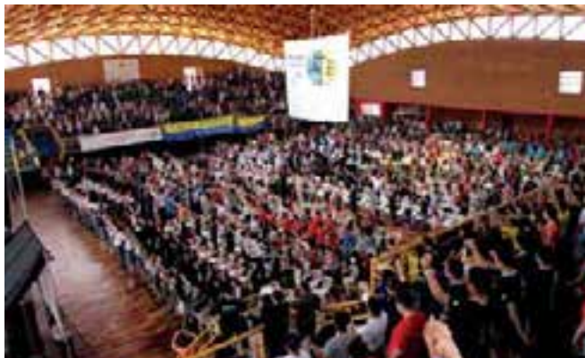
Vista del gimnasio donde se llevó a cabo este evento.

Del 22 al 26 de octubre pasado se realizó, en el parque Quiteria, de la ciudad de Encarnación, el II Congreso Nacional de Jóvenes del Paraguay, bajo el lema “Navegando por Fe”. En este encuentro, participaron más de 1.450 jóvenes de todo el país, en representación de todos sus distritos.