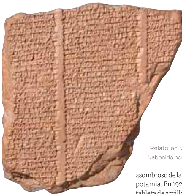
“Relato en verso de Nabonido”, donde Nabonido nombra a Belsasar su corregente.

En 1881 se descubrió otra tableta de arcilla con texto cuneiforme, llamada “La crónica de Nabonido”. Allí se nos dice que Nabonido solía ausentarse de su ciudad capital, Babilonia.