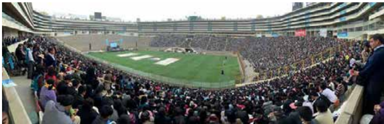
El Estadio Monumental de Lima, sede de la celebración de la expansión de Nuevo Tiempo.