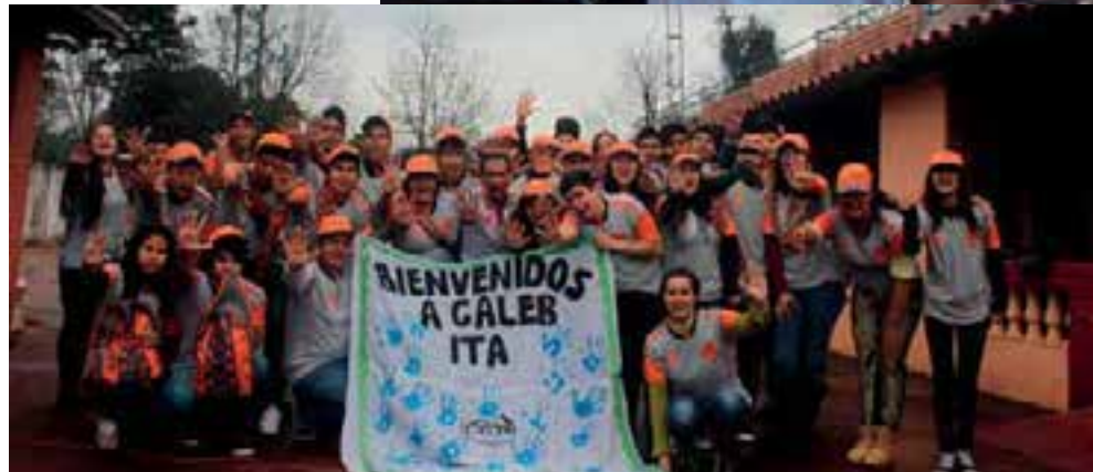
Motivados por el servicio a Dios y al prójimo, los Calebs de Paraguay sirvieron a la comunidad.