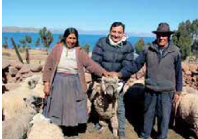
Motivados por el amor al Dueño del universo, hubo un compromiso de fidelidad total.