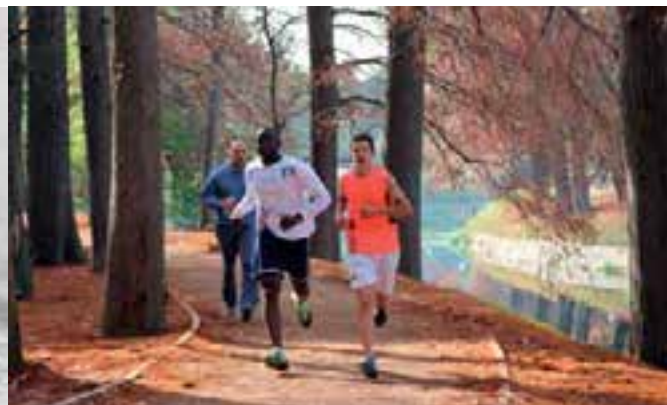
Identificados con el mensaje de salud, los adventistas del Uruguay llegan a personas a las que no podrían alcanzar de otro modo.